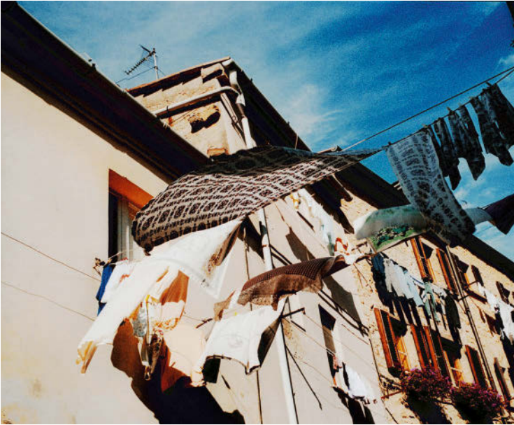
Für Besucher malerisch, für Bewohner Alltag: Wäsche flattert in Volterra im Wind.

droht. Da verziehen wir uns dann lieber ans Meer oder machen Landurlaub in einem kleinen agriturismo – bis es nach einem langen, langen Sommer im Oktober wieder ruhiger wird und das Wetter milder.