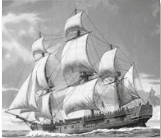
„HMS Resolution“ (neuzeitliche Darstellung)

Zeichner hatten bei den Expeditionen die Aufgabe, die heute Fotografen und Kameraleuten übertragen werden: Die Erfolge eines solchen gewagten Unternehmens mussten in Wort und Bild dokumentiert werden. Den Namen Hawaii benutzte Cook für diesen Archipel nicht. Er nannte die Inselkette „Sandwich Islands“, zu Ehren des Staatsmannes John Montagu, des vierten Earl of Sandwich und wichtigsten Förderers des Kapitäns.