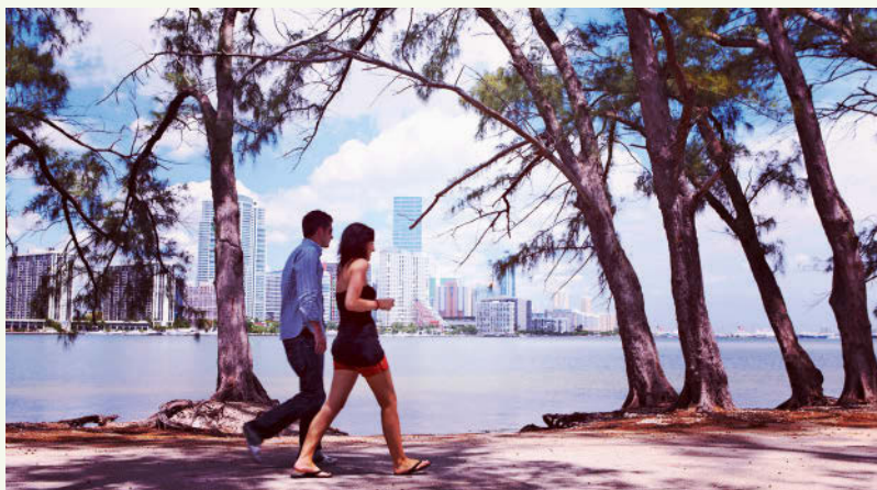
Die Insel Key Biscayne liegt direkt vor Downtown Miami

krieg (1861–1865). Wer schon immer mal richtig »versumpfen« wollte, macht am besten einen Ausflug in den unberührten Okefenokee Swamp an der Grenze zu Florida, ein wahres Labyrinth aus moorigen, pechschwarzen Teichen voller Alligatoren und engen Kanälen für auf Abenteuer eingestellte Kanufahrer.