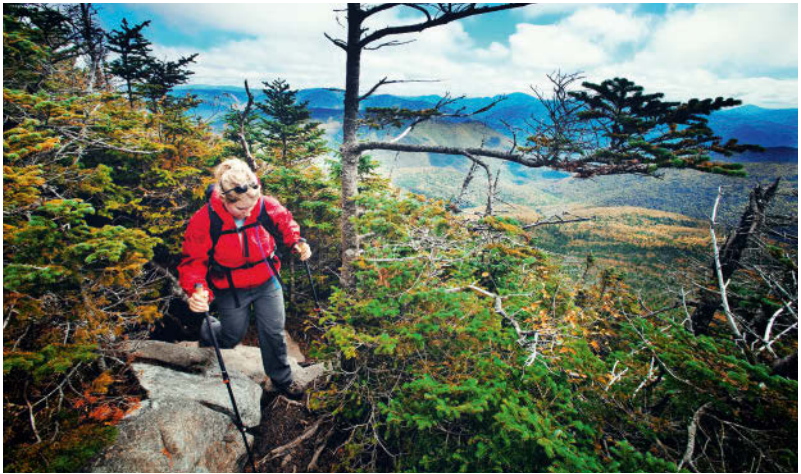
Blick vom Franconia Ridge Trail in New Hampshire über die White Mountains

ständig Wasser und sind in der Küstenebene schiffbar. Sie gewährleisteten aber auch die Wasserversorgung der Städte und die Bewässerung von Agrarflächen. Gletscher der Eiszeit haben allein in Maine 2200 Seen hinterlassen. Zu den imposantesten Überbleibseln dieser Epoche gehören die fünf Großen Seen, Lake Ontario, Erie, Huron, Michigan und Superior an der kanadischen Grenze, das größte Süßwasserreservoir der Erde. An der Verbindung von Ontario- und Eriesee liegt mit den Niagarafällen eines der großen Naturwunder der Erde.