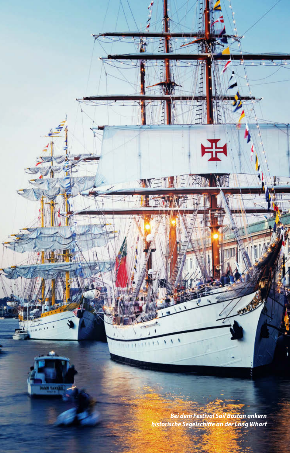
Bei dem Festival Sail Boston ankern historische Segelschiffe an der Long Wharf