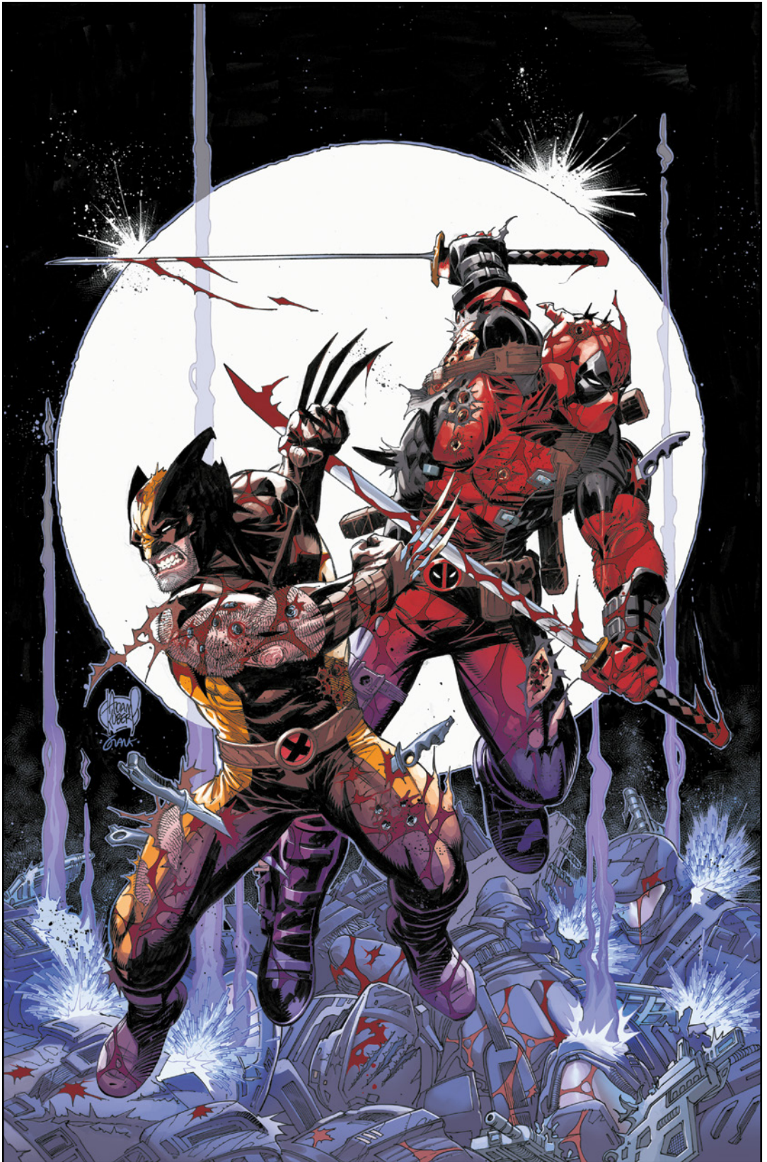
Deadpool & Wolverine: WWIII (2024) 1 Cover von ADAM KUBERT