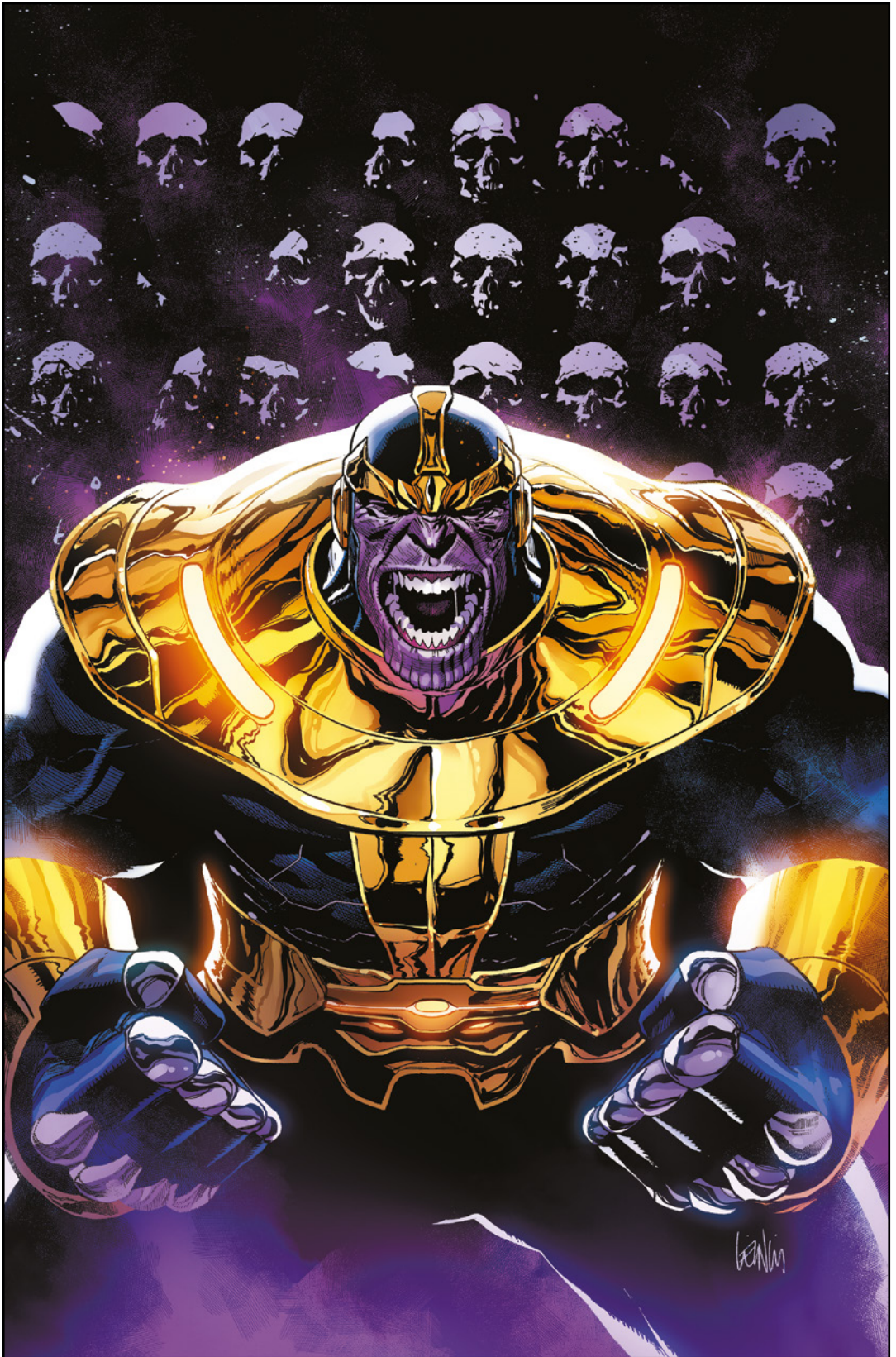
Thanos (2024) 1 Cover von LEINIL FRANCIS YU