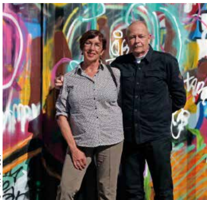
130mu