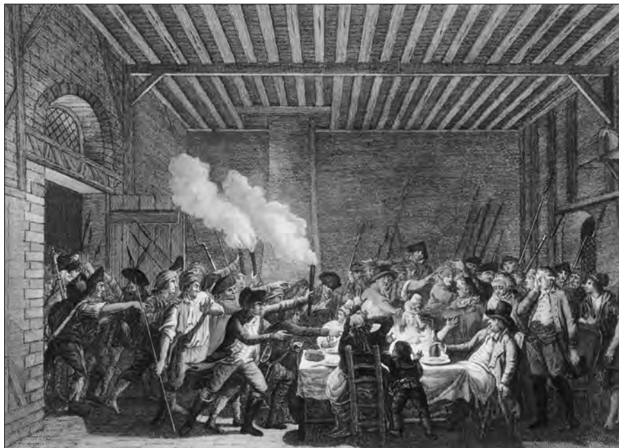
Abb. 3: Verhaftung Ludwigs XVI. in Varennes. Zeitgenössischer Kupferstich.

der König seine Pläne tatsächlich hätte umsetzen können, d. h. ob die europäischen Monarchen ihm wirklich die gewünschten Truppen zur Verfügung gestellt hätten, muß eine offene Frage bleiben. In aller Eindeutigkeit aber offenbarte sein Fluchtversuch, daß das Projekt der konstitutionellen Monarchie als Ausgleich zwischen der revolutionären Souveränität der Nation und dem überkommenen monarchischen Herrschaftssystem kaum eine Zukunft haben würde. Und zugleich rückte nun mit der Verbindung von Innenpolitik und Kriegsgefahr eine Thematik in den Mittelpunkt der Politik, die in der Folgezeit den Kurs der Revolution grundlegend prägen, vor allem wesentlich zur weiteren revolutionären Radikalisierung beitragen sollte. (Vgl. Dok. 7)