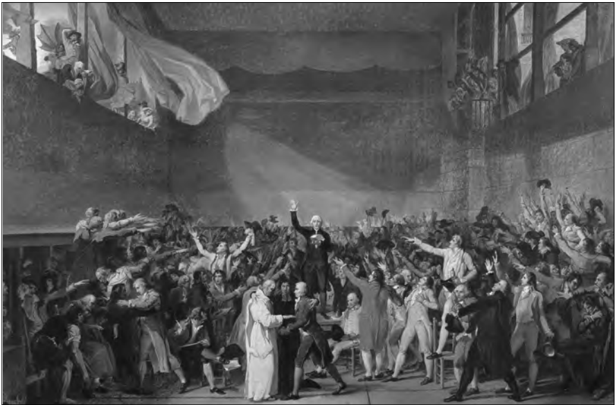
Abb. 1: Der Ballhauschwur vom 20. Juni 1789: Die Mitglieder der Nationalversammlung schwören, nicht eher auseinanderzugehen, bis eine Verfassung für Frankreich erarbeitet ist. Gemälde von Jacques Louis David (1789).

Politische Veränderungen erwartete Anfang 1789 in Frankreich jedermann. Die Wahlen zu den Generalständen, die erstmals seit 1614 wieder zusammentreten sollten, waren in vollem Gange, in den Wahlbezirken wurden die cabiers de doléances , die Beschwerdehefte abgefaßt, auf deren Grundlage die Vertreter der Stände gesellschaftliche und politische Veränderungen anmahnen sollten, das Zauberwort Reform war in aller Munde. Und doch konnte niemand die revolutionäre Dynamik vorhersehen, die Frankreich wenige Monate später erfaßte. Schon bald nach der Eröffnung der Generalstände am 5. Mai 1789 begannen sich die Ereignisse zu überschlagen. Am 17. Juni erklärten sich die Vertreter des Tiers Etat , des Dritten Standes zur Nationalversammlung, d. h. zur Vertretung der ganzen französischen Nation, und drei Wochen später stellten sie sich die Aufgabe, dem Königreich eine neue Verfassung zu geben. Kurz darauf, am 14. Juli, stürmte die Pariser Bevölkerung die Stadtfestung Bastille und verlieh der politischen Bewegung damit einen neuen, revolutionären Charakter. Die fol-