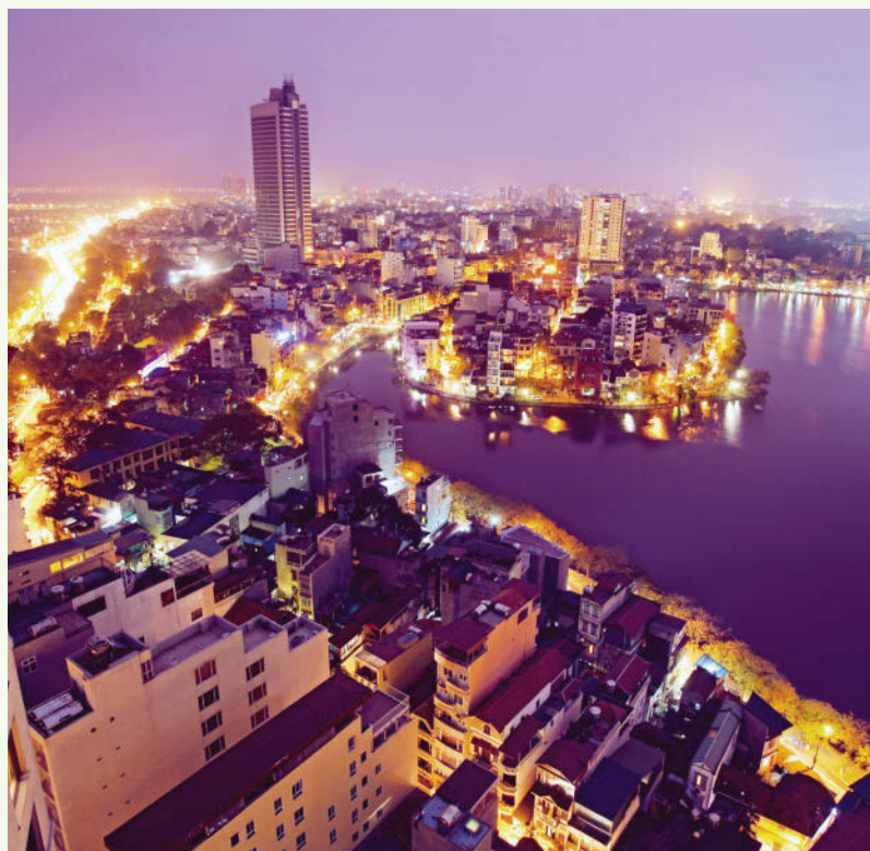
Handtuchschmal oder himmelhoch: Häuser an Hanoi's Truc-Bach-See