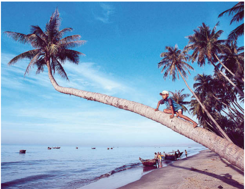
Am Strand von Mui Ne

Das gilt umso mehr für das Mekong-Delta , ein gigantisches Fluss- und Kanalsystem von 40 000 km 2 Fläche – fast so groß wie die Schweiz. Den Reichtum der Natur kann man mit Händen fassen. Reisfelder bis zum Horizont, Gärten mit tropischen Früchten,