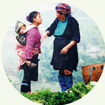
Hmong-Frauen beim Schwätzchen

Immer beliebter werden Motorradtouren durch Vietnams Berge, besonders rund um Ha Giang . Dort liegt der UNESCO-Geopark Dong Van nahe der chinesischen Grenze, eine der beeindruckendsten Karstlandschaften Vietnams.