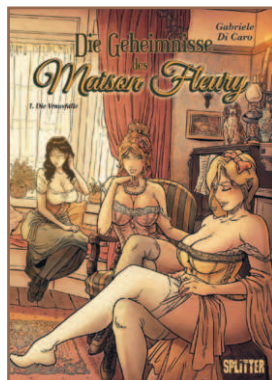
Band 1 Die Venusfalle