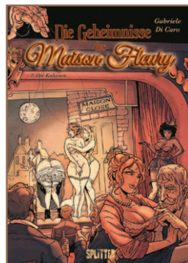
Band 2 (Juni 2024) Die Kulissen