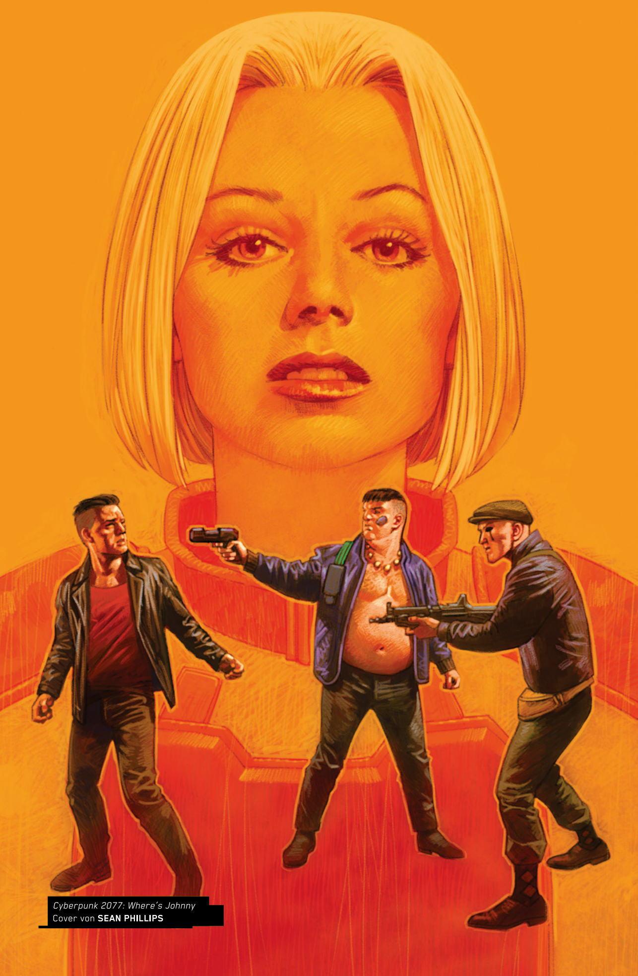
Cyberpunk 2077: Where's Johnny Cover von SEAN PHILLIPS