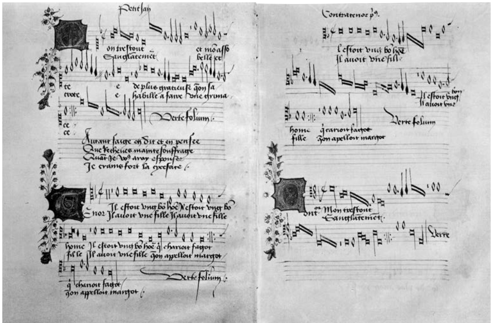
»Lesefeld-Notation« in dem um 1475 geschriebenen »Mellon-Chansonnier«: links oben der Superius (Oberstimme), darunter der Tenor, rechts oben »Contratenor primus«, darunter »Contratenor secundus«

»alla mente«, mit ihm verbundene direktere Identifizierungen mit? Fraglos dürfen wir es nicht als durch Schriftlichkeit abgelöst vermuten, auch und gerade nicht bei partiturgemäßen Aufzeichnungen der mit der Altarweihe von Notre-Dame in Paris (um 1182) verbundenen Organa oder bei den in Handschriften des 15./16. Jahrhunderts als »Lesefelder« nebeneinander gestellten Stimmen; ohnehin lässt sich, besonders bei den frühen, schwer entscheiden, ob sie primär als Dokumente oder zum Gebrauch bei Aufführungen bestimmt waren. Welch schwierige Ambivalenz, da Memorieren und Strukturverständnis einander zuarbeiten! Je höher kompositorische Ansprüche lagen, desto höher auch die beim detaillierten Memorieren, dies wohl aufgewogen durch die Aussicht bei werkhaften Ganzheiten, als solche vergegenwärtigt werden zu können – zwar weniger detailfixiert, jedoch mehr Übersicht versprechend. Wog das die Verschiebung auf, tröstete gar fürs allmählich verlorengehende direktere, sich mit der Einzelheit »innig identisch machende« »alla mente«?