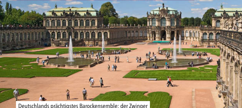
Deutschlands prächtigstes Barockensemble: der Zwinger

Es liegt ein Zauber über dieser Stadt. Wenn die Morgensonne das Wasser der Elbe glitzern und die berühmte Altstadtsilhouette aufleuchten lässt, dann geraten auch die Einheimischen selbst immer wieder ins Schwärmen. Und heute mehr denn je, da die mächtige steinerne Kuppel der Frauenkirche das Stadtbild wieder komplettiert.