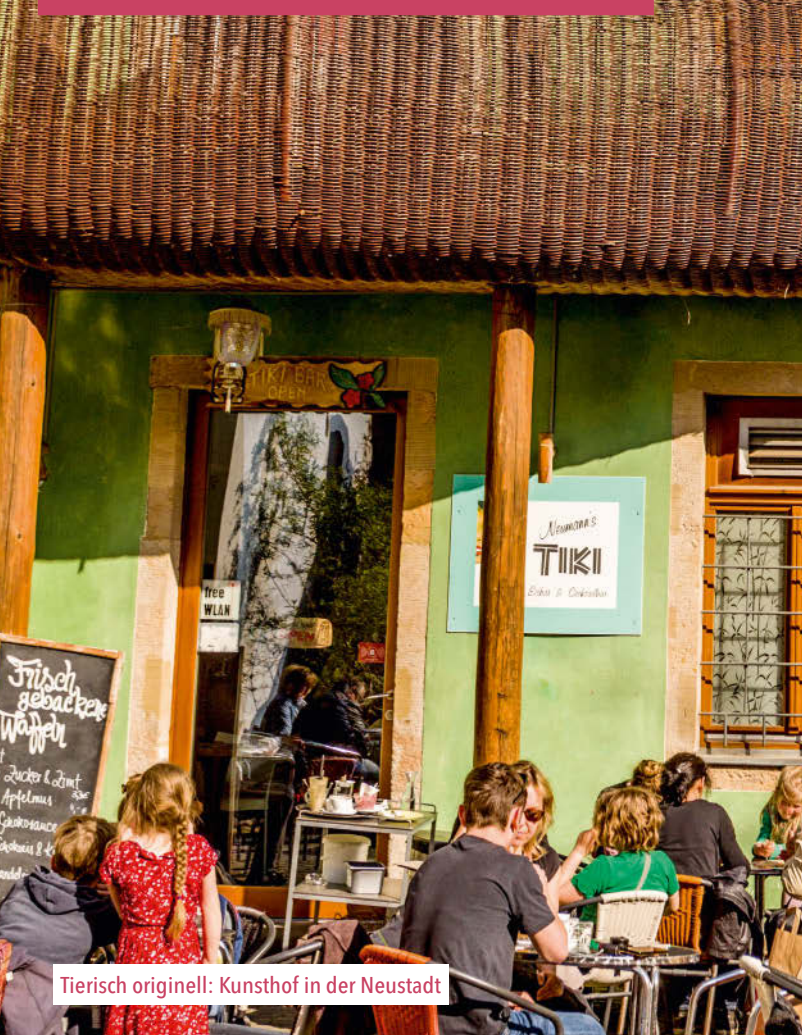
Tierisch originell: Kunsthof in der Neustadt