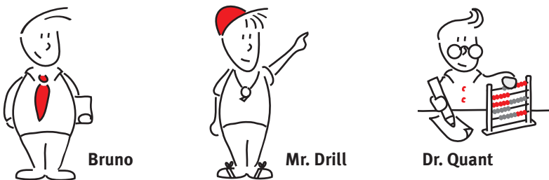
Abbildung 1: Überblick über die Akteure.

Um den Zusammenhang der einzelnen Kapitel besser zu verdeutlichen, wird ihre Abfolge durch die Geschichte eines angehenden Fußballmanagers Namens Bruno untermalt. So wie ein Anleger ein ausgewogenes Portfolio erreichen möchte, will Bruno eine erfolgreiche Fußballmannschaft aufbauen. Bruno stehen bei seinen Entscheidungen zwei Spezialisten zur Seite: der Trainer Mr. Drill und der Spieltheoretiker Dr. Quant. Während Mr. Drill wichtige Tipps, Einschränkungen oder Hinweise nochmals explizit hervorhebt und damit leichter auffindbar macht, vermittelt Dr. Quant theoretisches, mathematisch fundiertes Wissen. Abbildung 1 zeigt die Akteure im Überblick.