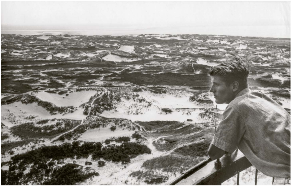
HP Zimmer Amrum 1956