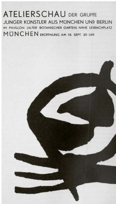
Faltblatt zur ersten gemeinsamen Ausstellung im Botanischen Garten, München 1957