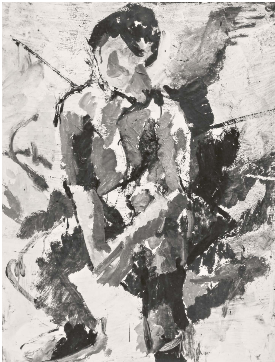
HP Zimmer Entkleidung Christi nach El Greco 1957 Öl auf Leinwand 50×33cm