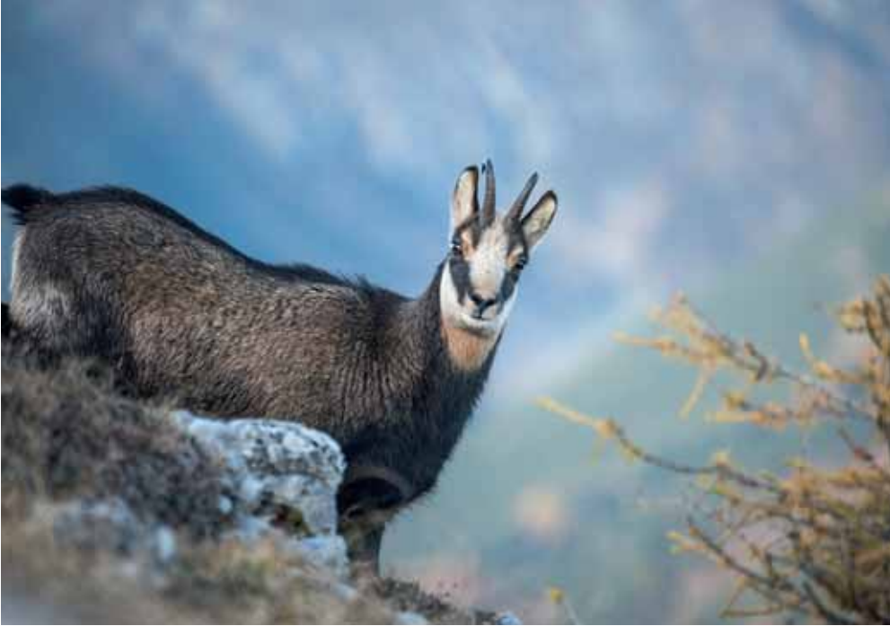
Abbildung 2: «Zwei grosse braune Augen schauen mich an ...». Ein Jagdereignis mit einer Gämse beeinflusste Brunies zukünftige Einstellung zur Natur.

Vergeblich, der Hinterkörper ist gelähmt. In febernder Eile steige ich hinunter und rutsche zur Geröllhalde hinab, alle Gefahren missachtend. Wenige Schritte vor mir liegt das Opfer. Mit zitternden Knien näherte ich mich ihm. Was sehe ich? Das arme Tier lebt noch. Zwei grosse braune Augen schauen mich an in stummer Qual, vorwurfsvoll, als wollten sie sagen: «Warum hast du's mir angetan, was tat ich dir bloss zuleide?» Starr vor Entsetzen und Grauen, wehes Leid im Herzen, ist mir, als sähe ich plötzlich die unendlich gütigen Augen meiner Mutter. Wirr jagen Gedanken und Erinnerungen aus meiner frühesten Kindheit durcheinander. Mutter, wie hast du mich strafend angeschaut, als ich stolz die erste Gemse heimtrug. «Chi vo a chatscha svanatscha – wer auf die Jagd geht, geht irre.» Jetzt nach Jahren, verstehe ich den Sinn ihrer Worte. Ich glaube sie in diesem Augenblick wieder zu hören. Verzweiflung kommt über mich. Ich suche nach Hilfe, schreie verstört nach meinem Kameraden. «Auf die Seite»,