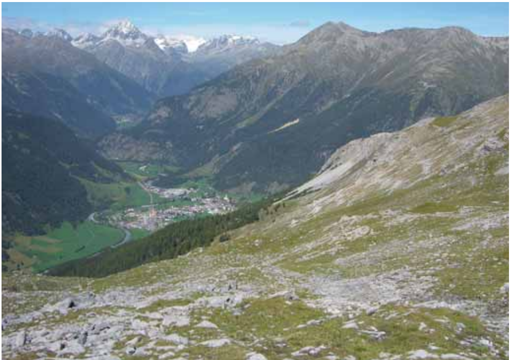
Abbildung 1: Zernez (im Bildzentrum) war Ausgangspunkt und Hauptquartier für viele Forschungspioniere im Schweizerischen Nationalpark. Blick vom Murtaröl im Nationalpark ins Unterengadin.