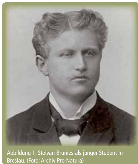
Abbildung 1: Steivan Brunies als junger Student in Breslau.

In der Radio-Erzählung «Meine letzte Gemse» schilderte Brunies mit starken Bildern das Erlebnis des letzten Jagdausflugs, den er vor einem längeren Studienaufenthalt im Ausland unternommen hatte. «Unter mir, zwischen Felsklötzen, tritt scheu eine Gemse auf die Geröllhalde; sie steht still, schaut um sich, vorsichtig nach allen Seiten sichernd. Ich blicke gespannt nach ihr, verhalte mich still. Aber da ist keine Zeit zu verlieren, denn gar flink ist das Bergwild. Mit einigen hastigen Sprüngen entschwindet es wie ein Schatten leicht den Blicken und dem Geschoss des Jägers. Mit wenigen Sätzen hat sich jetzt das Tier mir genähert. Bemerkte hat es mich nicht.