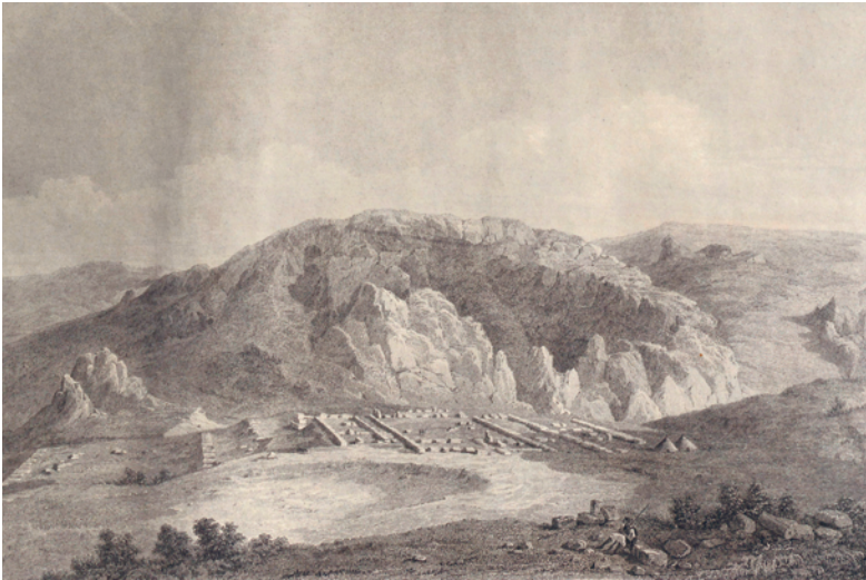
Abb. 1: Der Große Tempel in einem Stich von Ch. Texier (1839)

Während die Reiche Ägyptens, Babyloniens, Assyriens oder der persischen Achämeniden aufgrund ihrer Erwähnung in der Bibel im Gedächtnis der Menschheit verankert waren, blieben die Hethiter und ihre Hauptstadt bis ins frühe 20. Jahrhundert unbekannt. Als Charles Texier als erster Europäer 1834 die Ruinen bei dem zentralanatolischen Dorf Boğazköy besuchte und 1839 Pläne und Abbildungen publizierte, rief er großes Staunen hervor (Abb. 1). Man konnte sich nicht vorstellen, daß ein unbekanntes Großreich ausgerechnet auf dem unwirtlichen anatolischen Plateau zu suchen sei. Gemäß den gültigen Paradigmen hielt man die