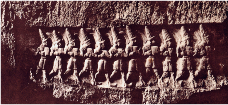
Abb. 3: Die zwölf Götter in der Kammer B von Yazılıkaya (ca. 1861)

ment beim Bau der Eisenbahnen lenkte das Interesse auf Zentralanatolien und damit auch auf Boğazköy.