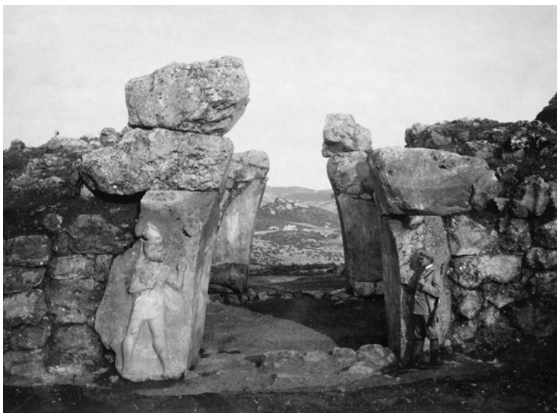
Abb. 5 a, b: Das Löwentor (oben) und das Königstor (unten) nach den Ausgrabungen 1907

von Fundstücken für ein Museum, sondern die Klärung wissenschaftlicher Fragestellungen. Dies führte zu einer Abgrenzung gegenüber den Museen und zum Verlust der Finanzierung aus diesen Quellen. Gleich-