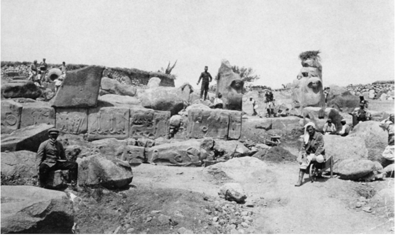
Abb. 2: Das Sphingentor von Alaca Höyük während der Ausgrabungen durch Th. Makridi 1907

Entstehung einer Hochkultur nur entlang der Flüsse Ägyptens und Mesopotamiens für möglich. Folgerichtig interpretierte man die Ruinen als das von Herodot, einem griechischen Historiker des 5. Jahrhunderts v. Chr., beschriebene Pteria. Alternativ wurde Tavium vorgeschlagen – eine Stadt, die in römischer Zeit als Hauptort der Region Galatien Bedeutung erlangte. Erst die Textfunde in akkadischer Sprache aus den Ausgrabungen von Theodor Makridi und Hugo Winckler erbrachten 1906 den Nachweis, daß es sich bei den Ruinen von Boğazköy um Hattuscha, die Hauptstadt des hethitischen Großreichs, handelte. Die Entdeckung einer unbekanntenen Hochkultur des Alten Orients war eine Sensation, die 1915 durch die Erkenntnis des tschechischen Sprachwissenschaftlers Friedrich Hrozny, daß deren Träger Indoeuropäer waren, noch gesteigert wurde.