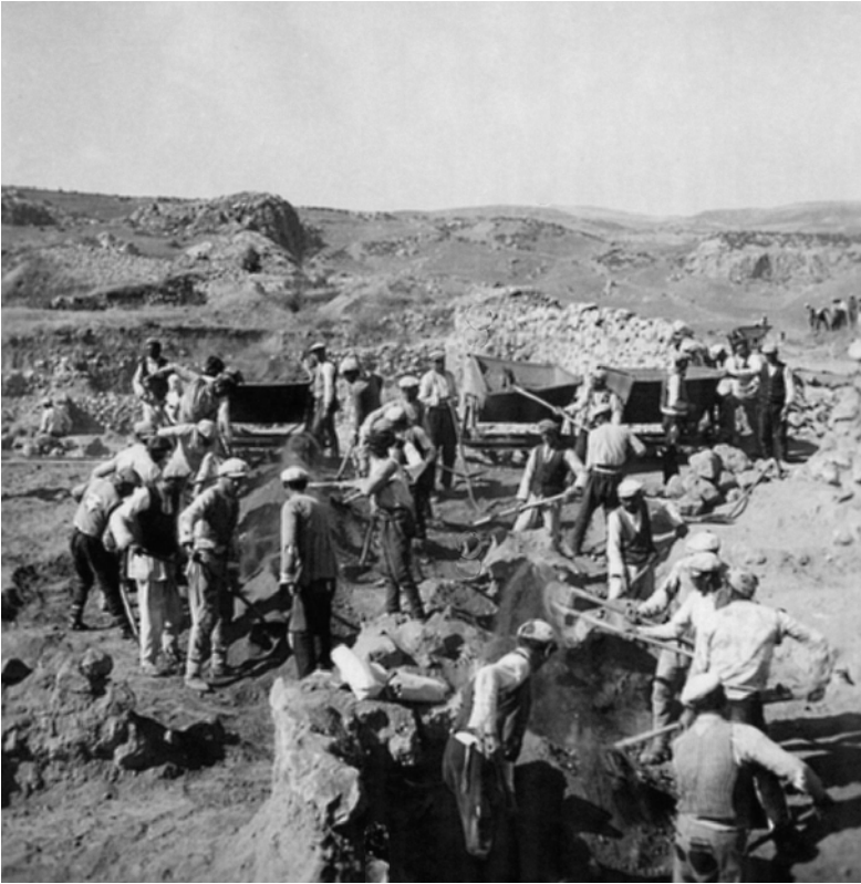
Abb. 6: Die Grabungen auf Büyüköale in den frühen 1950er Jahren

zeitig stellt die Zusammenarbeit Hugo Winklers mit dem Kaiserlichen Osmanischen Museum vertreten durch Theodor Makridi die erste Kooperation zwischen deutschen und türkischen Wissenschaftlern dar, die 1907 durch das Deutsche Archäologische Institut unterstützt wurde. Diese internationale und interdisziplinäre Gesamtkonstellation des auf die Klärung wissenschaftlicher Fragestellungen ausgerichteten Projekts war in dieser Zeit einzigartig und wegweisend.