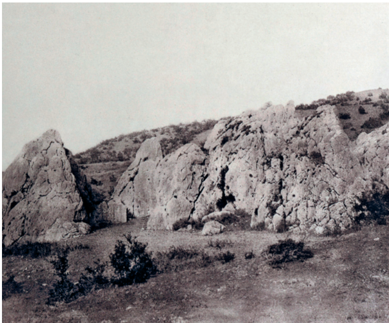
Abb. 4: Yazılıkaya vor Beginn der ersten Ausgrabungen (ca. 1864)

(Nişantepe, Abb. 53) und in Yazılıkaya dokumentiert worden waren (Abb. 40. 42. 43. 137), und solchen auf beschrifteten Steinen, die in den 1870er Jahren in Hama im heutigen Syrien gefunden wurden. Auch wenn diese Schrift, die man heute als Hieroglyphen-Luwisch kennt, damals nicht lesbar war, erkannte er den großen geographischen Verbreitungsraum dieser Zeichen. Denn sie finden sich auch auf Felsreliefs, die im Laufe des 19. Jahrhunderts sowohl in der zentralen als auch in der westlichen Türkei entdeckt wurden. Im Lichte der in Syrien gefundenen Inschriften bezeichnete er diese Kultur in Anlehnung an die in den ägyptischen Quellen Cheta und im Alten Testament Hittim genannten Völker als hethitisch, deren Zentrum man damals jedoch gemeinhin in Syrien lokalisierte. Ausgehend von diesen Überlegungen rekonstruierte Archibald Sayce einen umfassenden Kulturraum, der seiner Meinung nach von Syrien bis Westanatolien reichte. Zur Klärung seiner Hypothese strebte er seit 1882 die Erforschung zentraler Fundorte in Anatolien, unter ande-