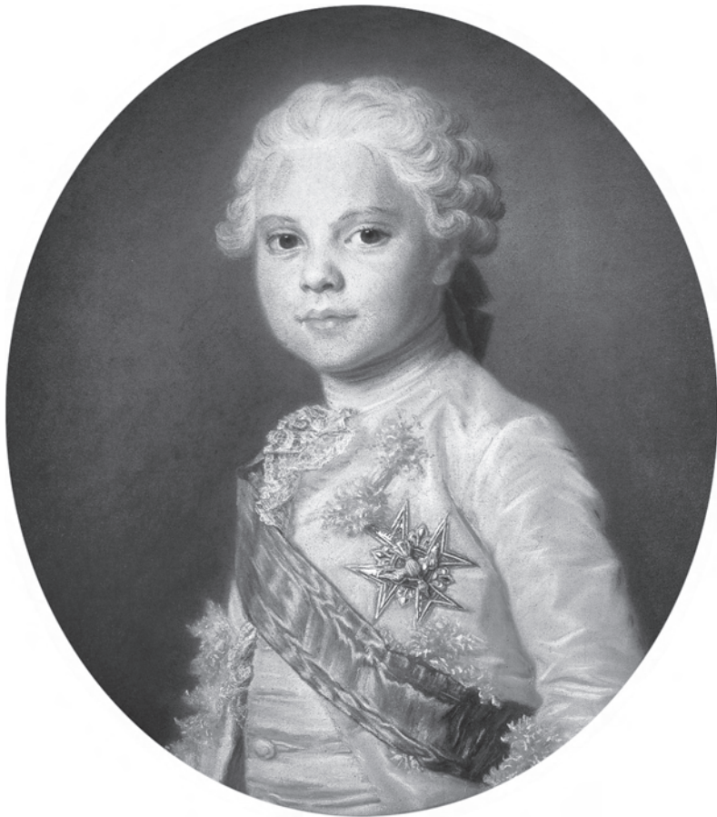
Duc de Berry, der spätere Ludwig XVI im Alter von neun Jahren. Pastell von Maurice Quentin de la Tour (1704–1788), Paris. Musée du Louvre

Prinz antwortete: «Ja, ich gestehe, dass ich es nur mit Bedauern verliere, aber ich habe es seit langem Gott als Opfer dargebracht.» 7 Die in ihrem Schmerz untröstliche Mutter schrieb an ihren Bruder Xavier: «Er ist mit soviel geistiger Würde, Mut, Resignation und Frömmigkeit gestorben wie ein Mann von dreißig Jahren.» 8