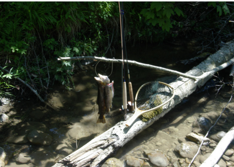
Ob Fliegenfischen oder Kunstköderfischen, Knoten werden immer gebraucht.

Dropshotangeln, oder eben, um die künstliche Fliege anzubringen. Dieses Buch stellt 40 Angelknoten vor. Das Buch passt in jeden Angelrucksack, sodass man entweder nachlesen kann, wie ein bestimmter Knoten genau ging, oder man auch nach einem Knoten für eine spezielle Situation suchen kann. Aber eines ist sicher, wenn Sie dieses Buch dabei haben, sollten Sie für jede Situation auch einen perfekten Knoten finden können.