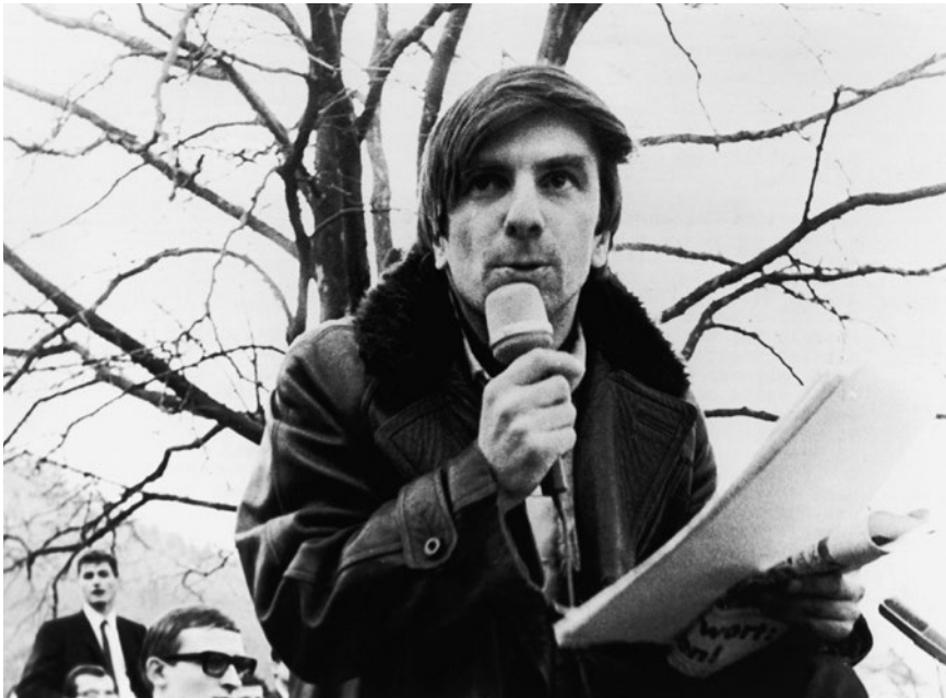
Abb. 5 Rudi Dutschke spricht auf dem FDP-Bundesparteitag in Freiburg zu Jungdemokraten (29. Januar 1968)

Das Charakteristische dieser spontanen Aufwallung, die heute meist als die Achtundsechziger-Bewegung bezeichnet wird, war, dass sie von vornherein keine ideologische Einheitsfront bildete, sondern aus einer Reihe höchst unterschiedlicher politikkultureller Gruppen bestand, deren Widersetzlichkeit sowohl überpersönliche als auch höchst individuelle Antriebsimpulse zugrunde lagen. Da gab es Marxisten, Anarchisten, Vietnamkriegsgegner, auf studentische Mitverwaltung Drängende, radikale Feministinnen, Beatles-Schwärmer, Hippies und Sexrebellen, die sich in Aktionskreisen, Roten Zellen, Selbsterfahrungsgruppen und Kommunen zusammenschlossen, ihre Manifeste in Zeitschriften wie Kursbuch , Alternative und Argument veröffentlichten oder einfach einmal auf die Pauke hauen wollten. 23 Neben Verbänden, welche wie die »Werkkreise« sogar das Proletariat für ihre Absichten zu gewinnen suchten, herrschten daher bei vielen Gruppen dieser Art Zielsetzungen