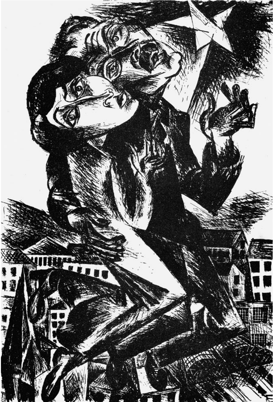
Abb. 4 Conrad Felixmüller: Menschen über der Welt. Rosa Luxemburg und Karl Liebknecht (1919)