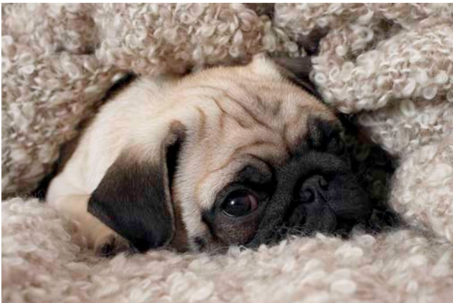
DIE RASSE zeigt Gemeinsamkeiten. Individuelle Veranlagung und Erfahrung machen jeden Hund einzigartig.

Temperament und Verhalten eines Hundes haben ihre Ursprünge in der Aufgabe, für die die Rasse früher gezüchtet wurde. Jagdleidenschaft, Hüteverhalten, selbstständiges oder kooperatives Handeln – all das lässt sich darauf zurückführen.