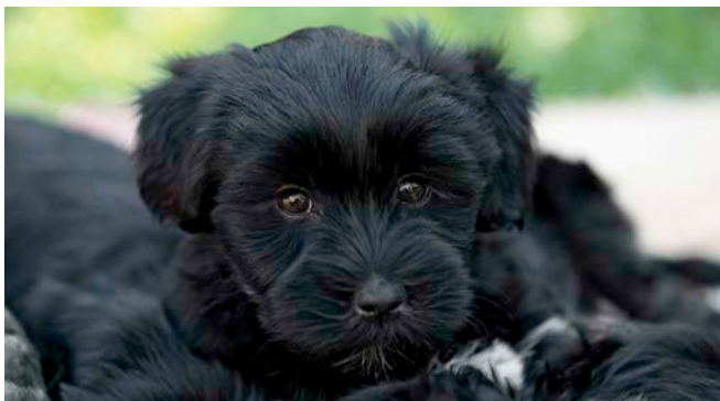
DIESER KLEINE FRATZ braucht später viel Fellpflege. Mögen Sie das?

Jeder hat eine Vorliebe für einen bestimmten Hundetyp. Bei manchen sind es die kurznasigen, kompakten Typen, andere schwärmen für windschnittige Hunde oder langhaarige Wuschel, einige lieben kleine quirlige Vierbeiner oder schätzen die großen und gemütlichen. Zum Glück gibt es bei jedem Hundetyp verschiedene Rassen. Da kann sich Ihr Herz verlieben und Ihr Kopf dafür sorgen, dass auch der Rest passt. Und wer weiß, vielleicht finden Sie ja eine ganz neue Liebe.