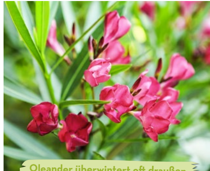
Oleander überwintert oft draußen.