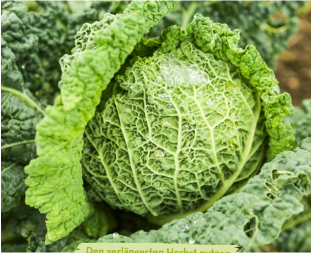
Den verlängerten Herbst nutzen

hut, Chinakohl, Rettich, Pak Choi oder Senfkohl. Halten Sie aber ein Schutzvlies bereit, das Sie bei Frost doppelt auflegen. Der Anbau von Fruchtgemüse wird aber nach wie vor vom ersten Frost beendet, Vlies schützt es nicht. Spät gesäeter China-kohl, Pak Choi oder Zuckerhut kommt bei Frost in den Keller und lagert dort. Wenn Sie die äußeren Blätter dran lassen, vertrocknen diese zwar, im Inneren bleibt's aber frisch. Auf die Beete kommt nach der Ernte Mulch.