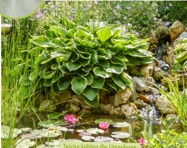
Teiche kühlen die Umgebung.