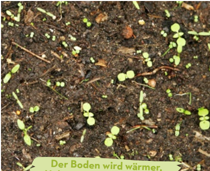
Der Boden wird wärmer, Unkraut wächst ganzjährig.

Auch wer den Klimawandel für ein Märchen hält, muss zugeben, dass sich die Prognosen von Wetterexperten immer häufiger bemerkbar machen. Das Wetter wird extremer: Trockenheit im Frühjahr, Hitze im Sommer und nass-kühle Winter.