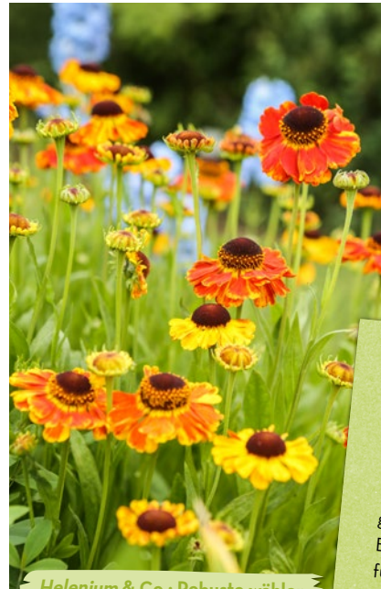
Helenium & Co.: Robuste wählen