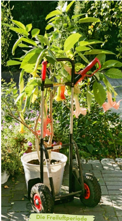
Die Freiluftperiode dauert länger.

Der größte Vorteil vom Klimawandel ist die um bis zu einem viertel Jahr verlängerte Gartensaison, was sich besonders bei Obst und Gemüse bemerkbar macht. Aber auch Kübelgärtner profitieren von milderem Wintern.