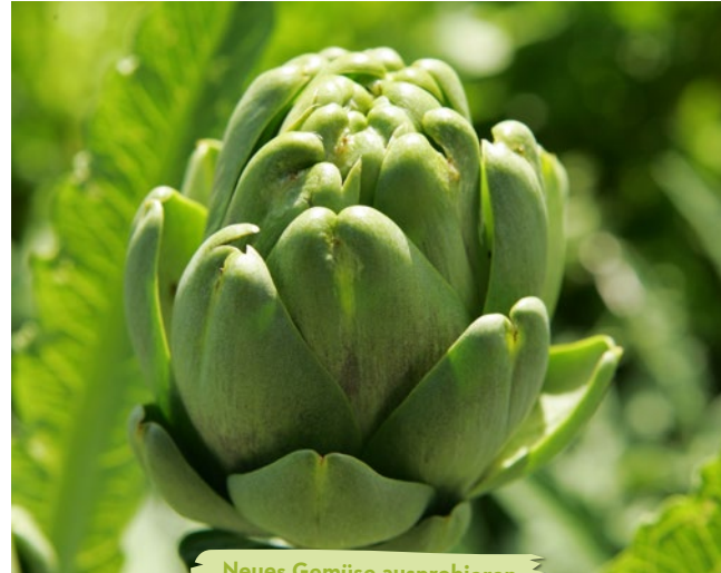
Neues Gemüse ausprobieren

Erntezeit interessant, so wie die Äpfel 'Wellant' oder 'Rockit'. Die Spätfrostgefahr bleibt natürlich. Das ist auch der Grund, weshalb sich Exoten wie Andenbeere, Guave oder Granatapfel immer noch überwiegend nur für experimentierfreudige Gärtner lohnen, die sich von einem Fehlschlag nicht entmutigen lassen. In den jetzt bereits wintermilden Gebieten werden allerdings vermutlich auch irgendwann solche Exoten im Freiland wachsen. Und eigentlich empfindliche Gewächshauskulturen wie Artischocken, Auberginen oder Melonen können sich bald auch fürs Freiland lohnen.