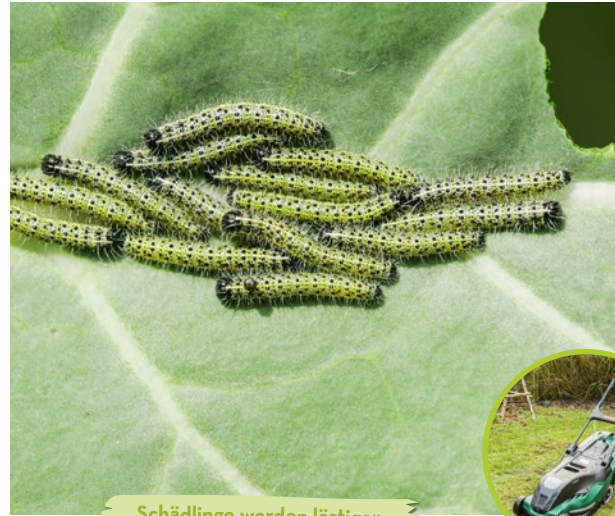
Schädlinge werden lästiger.