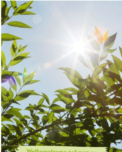
Wetterextreme nehmen zu.