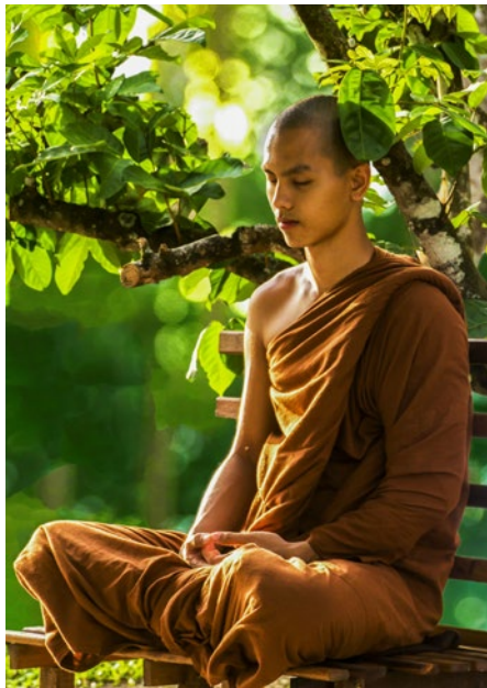
buddhistischer Mönch bei der Meditation