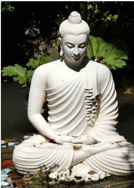
Statue von Siddharta Gautama, dem Begründer des Buddhismus

Betrachte die untenstehenden Bilder. Haben die dort dargestellten Personen dies im Buddhismus gefunden? Informiere dich über den Lebenslauf von Siddharta Gautama, dem Begründer des Buddhismus, dessen Statue auf dem linken Bild zu sehen ist. Arbeite dabei heraus, warum er den materiellen Reichtum ablehnt.