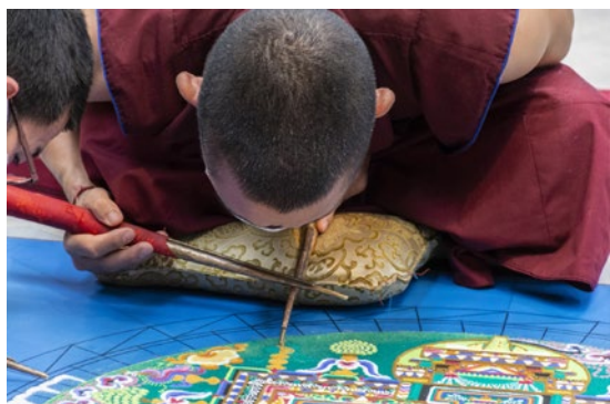
Mönch bei der Gestaltung eines Mandalas aus Sand