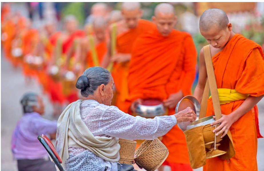
Bettelmönche bekommen Nahrung von der Bevölkerung gespendet