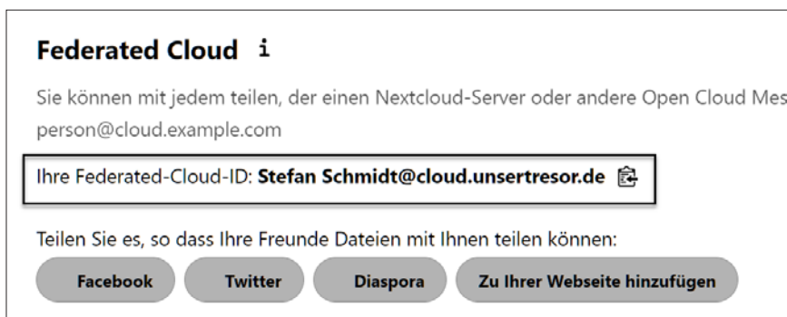
Abb. 1.1: Anzeige der eigenen Cloud-ID

Um Daten zwischen zwei verschiedenen Nextcloud-Installationen auszutauschen, benötigt man lediglich eine Adressierung (ID), die den jeweiligen Serveranbieter kenntlich macht. Ihre eigene ID wird im Abschnitt PERSÖNLICHE EINSTELLUNGEN|TEILEN angezeigt.