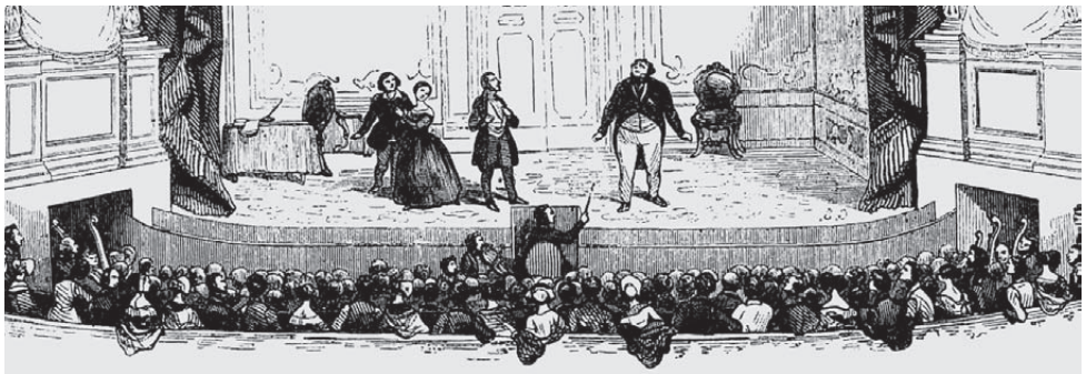
Abb. 2b: Orchester und Bühne im Théâtre Italien in Paris bei Donizettis Don Pasquale (L'illustration, Paris, 5. April 1843)