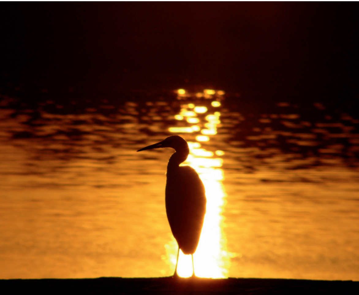
Abb. 1 Der Nil, die Sonne und die Tierwelt haben schon früh die Gedanken und Vorstellungen der alten Ägypter geprägt.