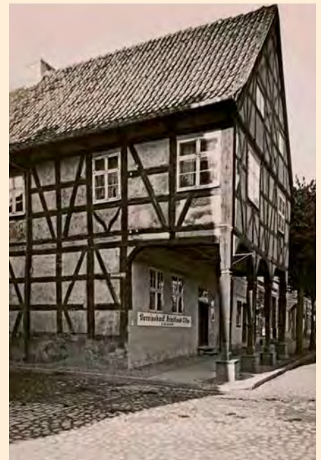
Friedland, Kreis Bartenstein: Altes Vorlaubenhaus, um 1925

Friedland, Kreis Bartenstein: Altes Vorlaubenhaus, um 1900. Vorlaubenhäuser sind zumindest an einer Seite mit einer Laube versehen. Meistens hat diese Laube einen eigenen Giebel, der früher oft auch einen Zweck bei Geschäfts- und Bauernhäusern hatte. Hier konnten Waren angeboten oder Dienstleistungen vor dem Haus erbracht werden, wie zum Beispiel bei Schustern, Sattlern, Küfern, Schmieden u.a. Errichtet sind diese Bauten oftmals aus Fachwerk, wenn auch der „Laubengiebel“ manchmal von gemauerten Säulen oder Pfeilern getragen wird. Verbreitet hat sich diese Bauweise vor allem im Bereich östlich der Elbe, also auch in Ostpreußen.