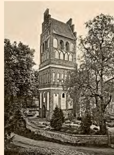
Gallingen, Kreis Bartenstein: Die Ordenskirche, um 1925