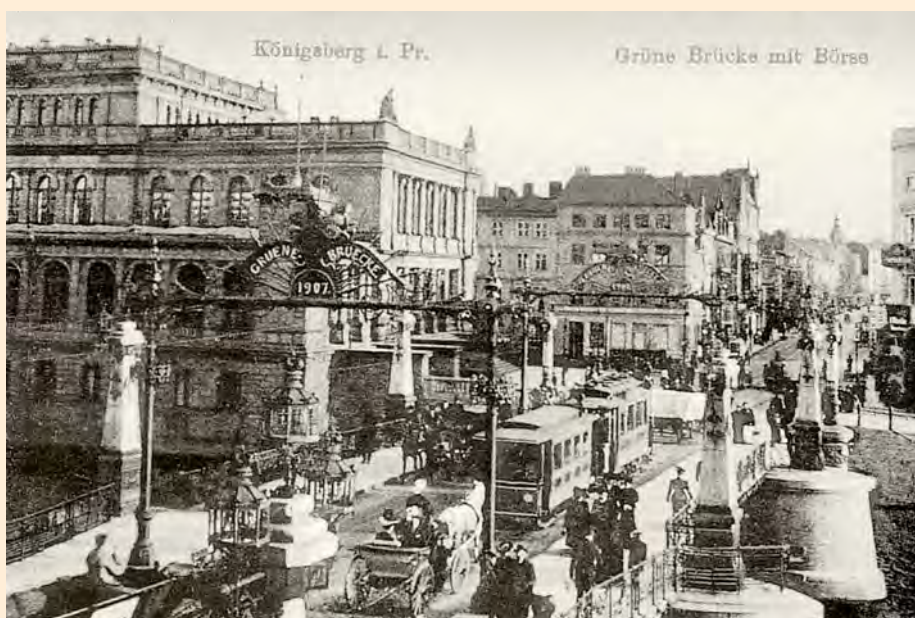
Königsberg: Börse und Grüne Brücke, um 1910