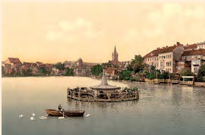
Königsberg: Schlossteich und Schloss, mit Schwanenhaus in der Mitte, um 1900