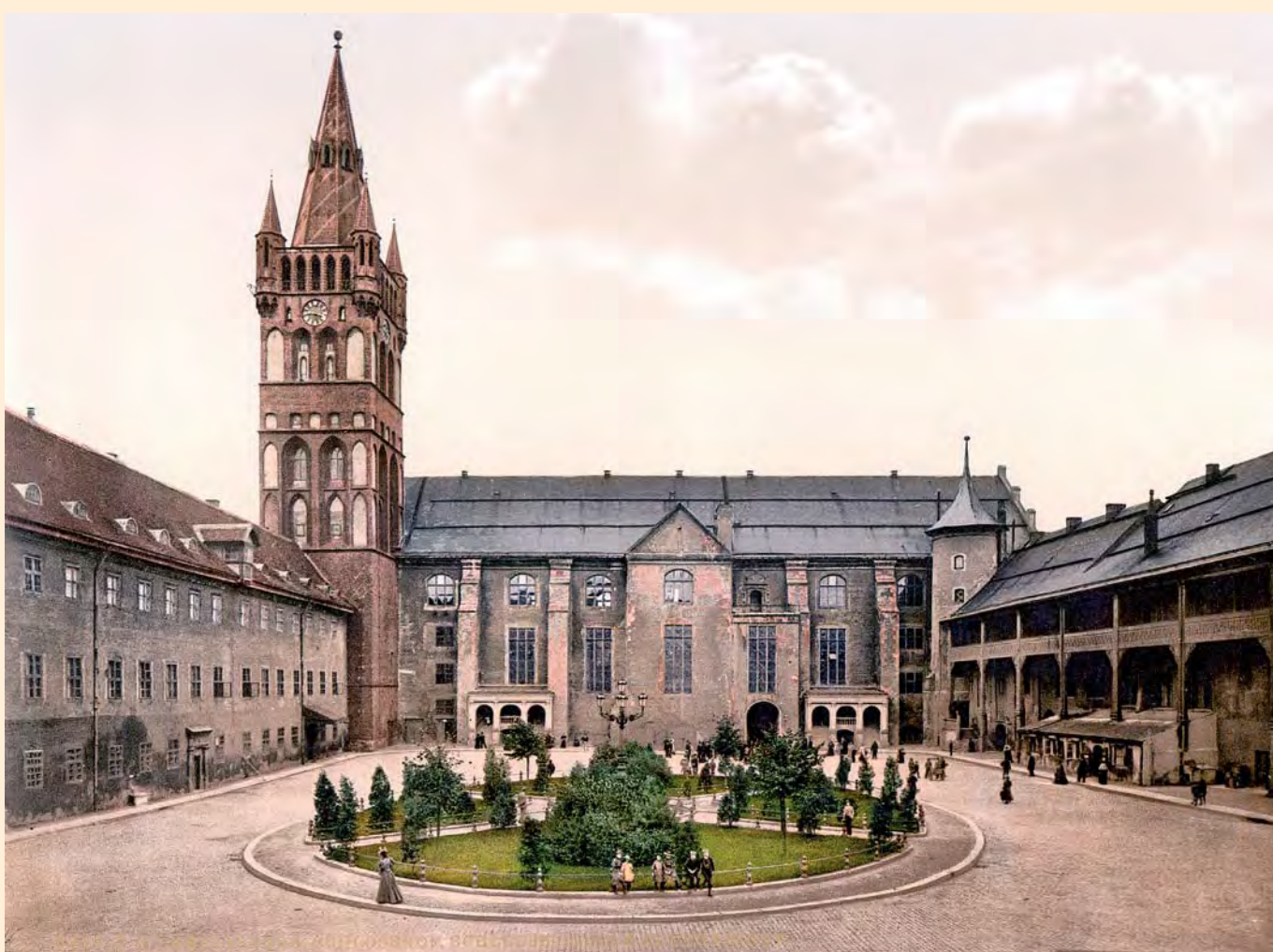
Königsberg: Der Innenhof des Schlosses, um 1900