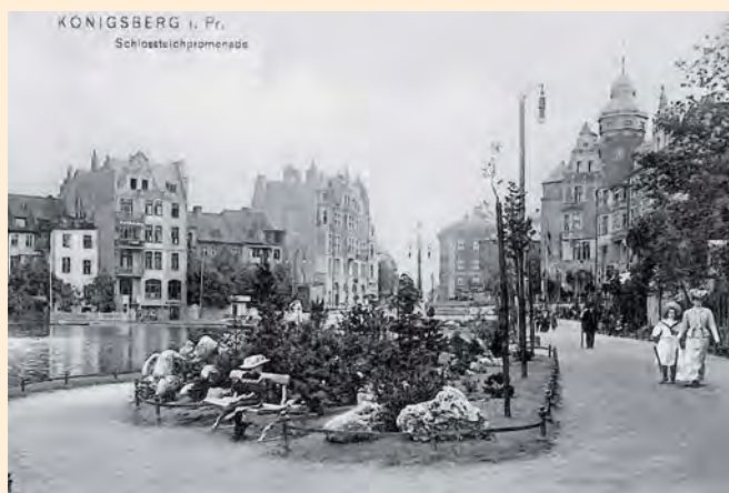
Königsberg: Schlossteichpromenade mit Spaziergängern, um 1910