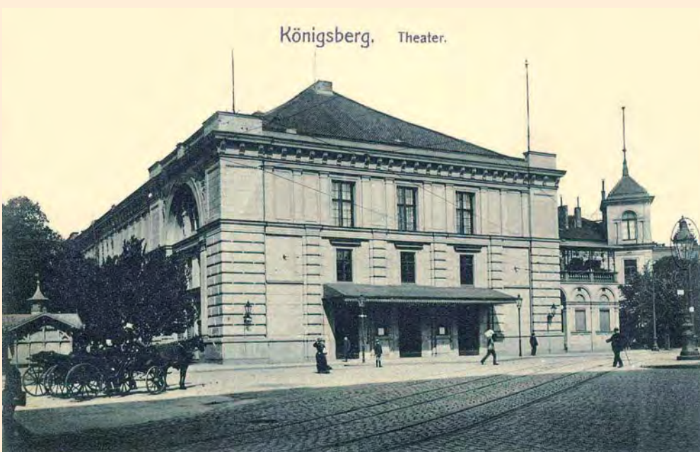
Königsberg: Das Stadttheater am Paradeplatz unweit des Schlossteichs, um 1910