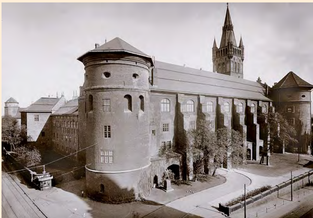
Königsberg: Blick auf das Schloss von Westen, um 1930