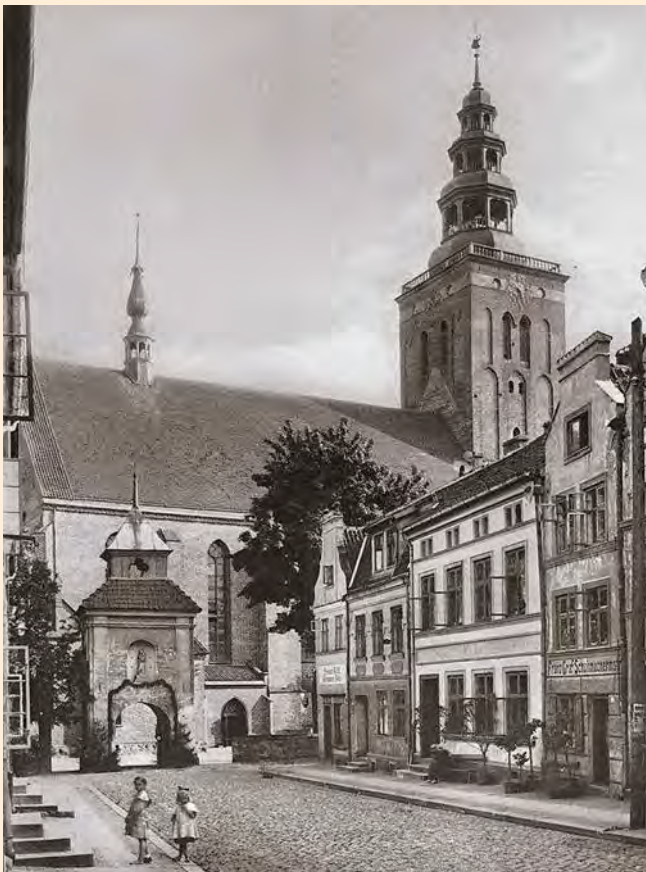
Bartenstein: Die Kirche von Bartenstein, um 1925.

Weitere Städte im Kreis Bartenstein waren die erste Kreisstadt Friedland, um 1335 gegründet, die zweite Kreisstadt Domnau sowie die Stadt Schippenbeil, die an der Mündung der Gube in die Alle lag.