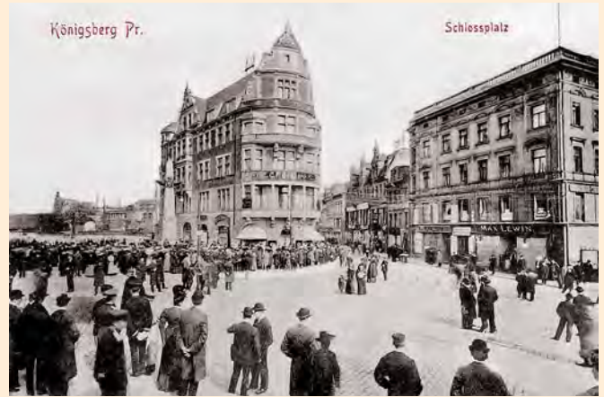
Königsberg: Am Schlossplatz, um 1910