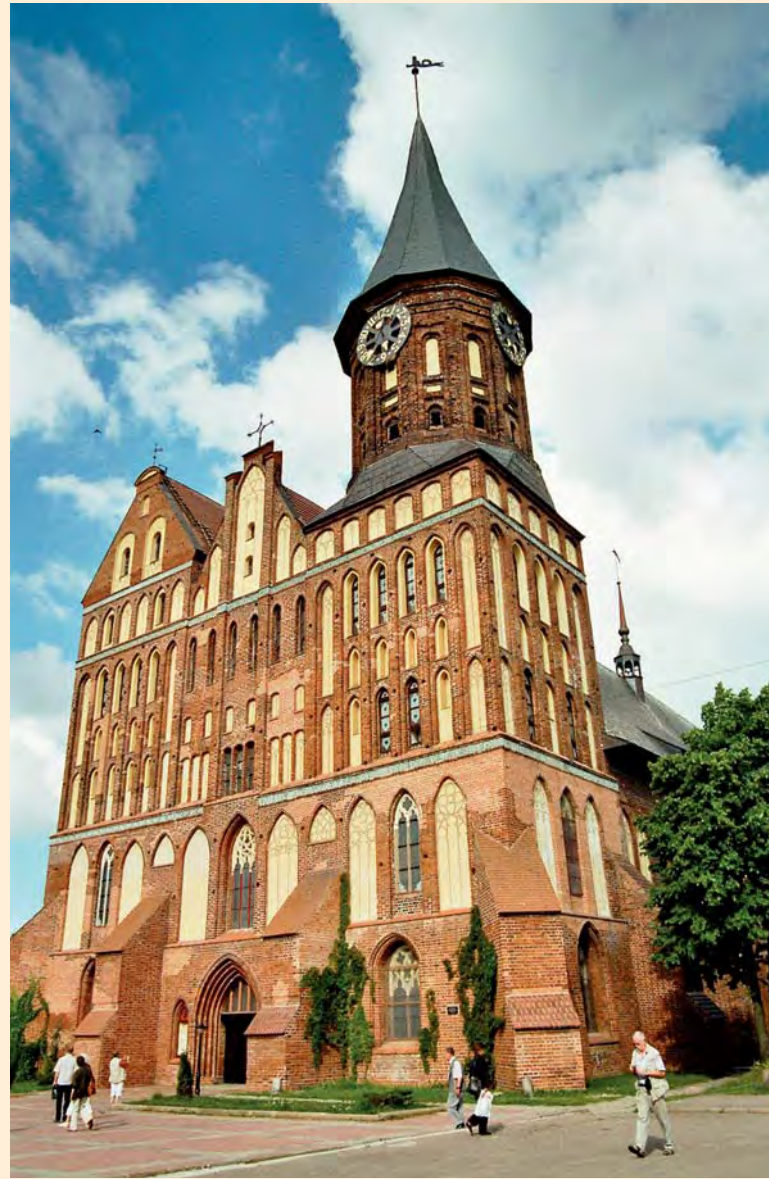
Königsberg: Der Dom zu Königsberg im Jahr 2008

Zwar wurde auch Königsberg im Laufe der Jahrhunderte von Kriegen, Pest und Bränden heimgesucht, doch dank seiner verkehrsgünstigen Lage florierte die Wirtschaft und es wurde zu Ostpreußens bedeutendstem Zentrum für Kultur und Wirtschaft.