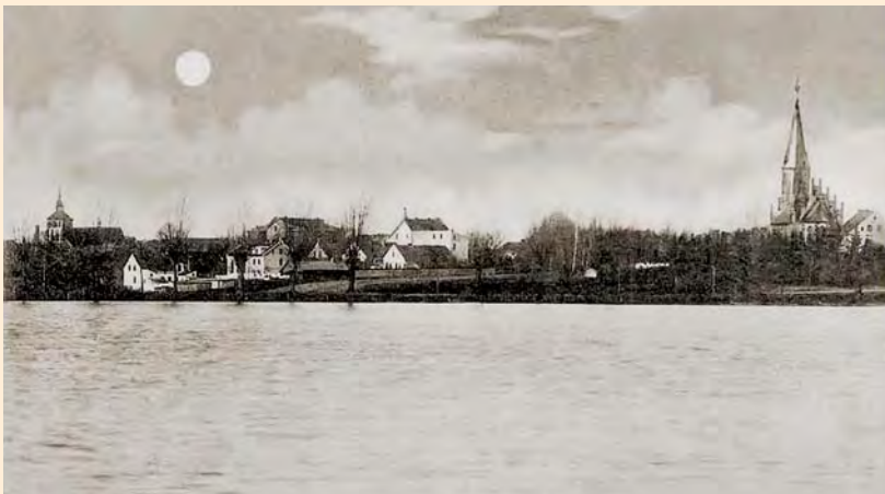
Bartenstein: Blick über den Oberteich auf die Stadt, um 1900