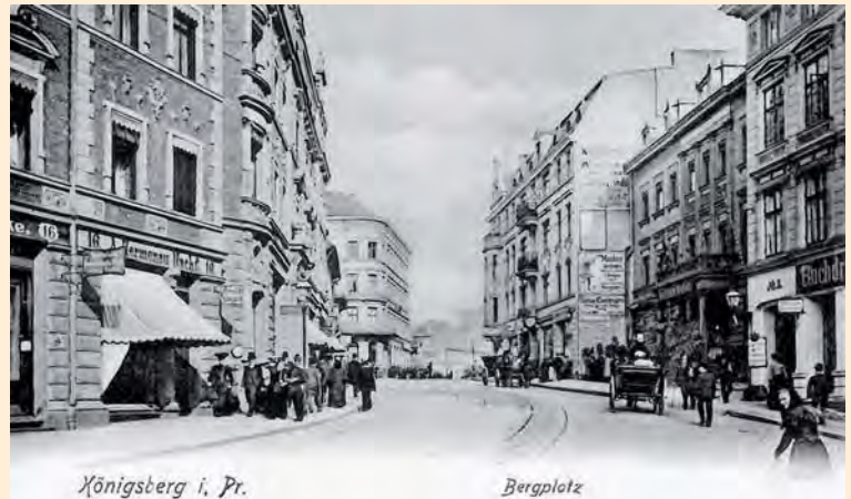
Königsberg: Der Bergplatz mit Blick zum Rossgärtner Markt im Jahr 1904