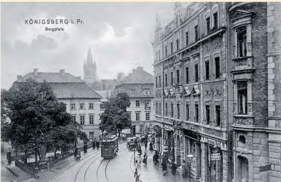
Königsberg: Die Straßenbahnhaltestelle am Bergplatz mit Schlossturm im Hintergrund, um 1910