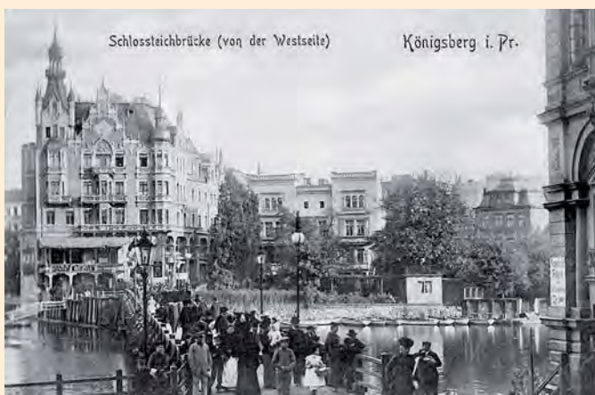
Königsberg: Schlossteichbrücke von der Westseite, um 1910