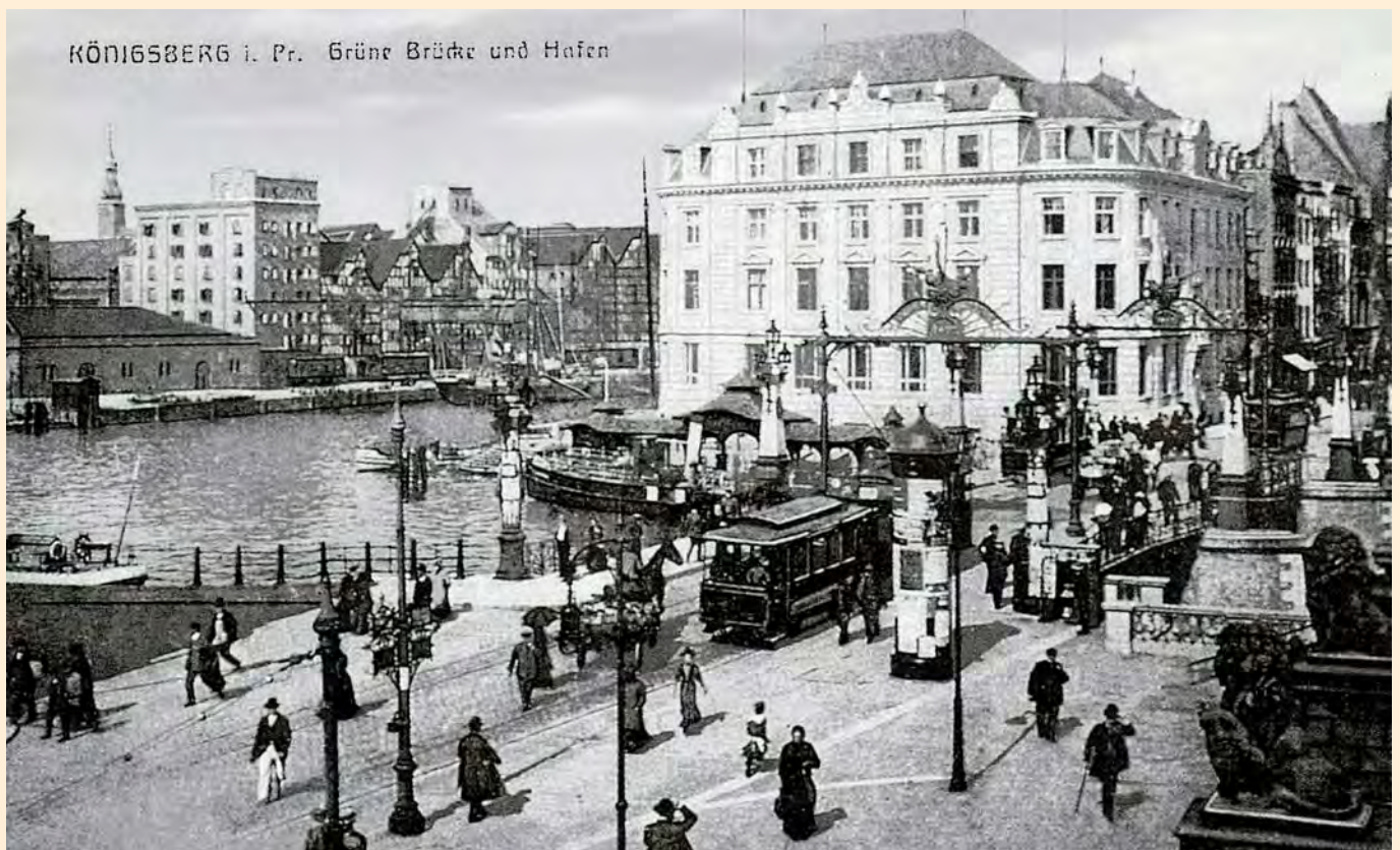
Königsberg: Die Grüne Brücke am Alten Pregel mit Straßenbahnhaltestelle