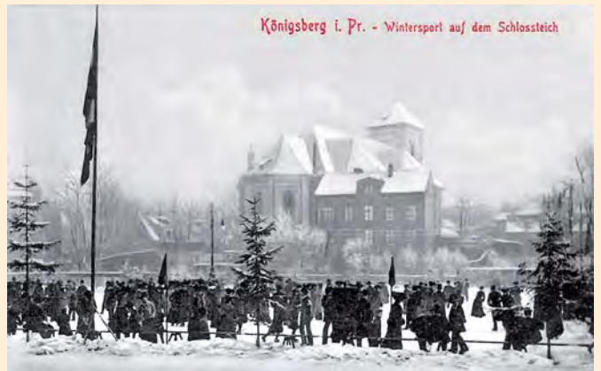
Königsberg i. Pr. - Wintersport auf dem Schlossteich