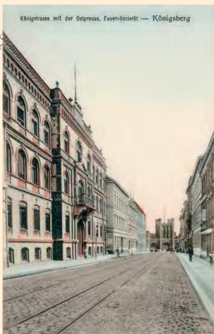
Königsberg: Königstraße mit der Ostpreussischen Feuersocietät mit Blick zum Königsstor, um 1920