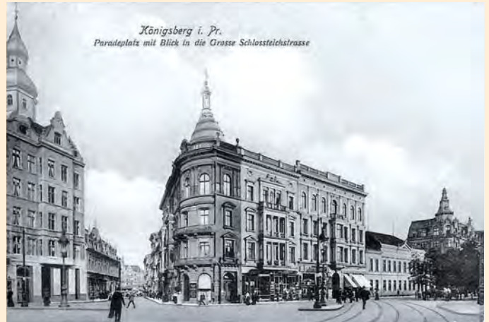
Königsberg: Paradeplatz und Blick in die Große Schlossteichstraße, um 1908