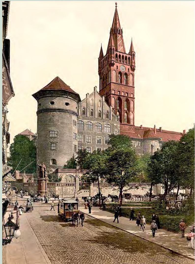
Das Königsberger Schloss mit Kaiser-Wilhelm-Denkmal. Im Vordergrund eine von Pferden gezogene Straßenbahn, um 1900.

Die Bevölkerung im Regierungsbezirk Königsberg nahm im Laufe des 19. Jahrhunderts stark zu und stieg von 1820 bis 1904 um mehr als das