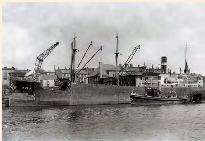
Königsberg: Der Dampfer „Tilsit“ mit Schleppkahn im Hafen