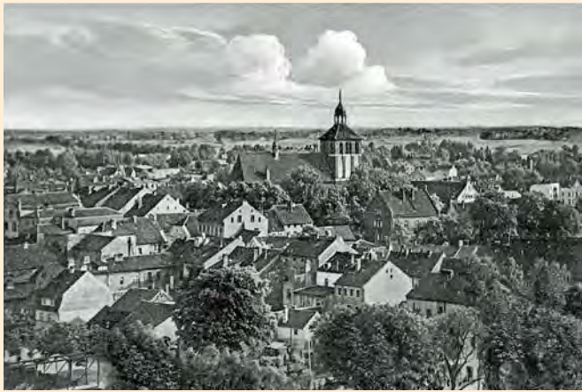
Bartenstein: Blick über die Stadt von Norden, um 1925