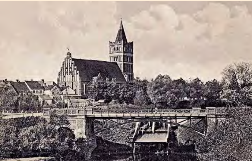
Friedland, Kreis Bartenstein: Ansicht von Stadt und Kirche aus der Perspektive vor dem Mühlentor, um 1905