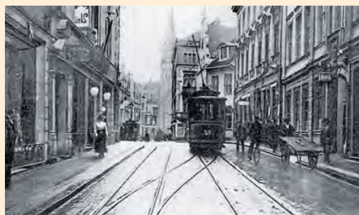
Königsberg: Junkerstraße mit Straßenbahn, um 1910