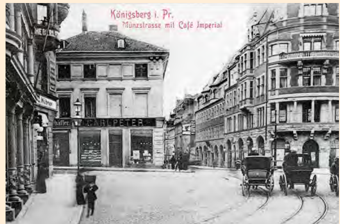
Königsberg: Münzstraße mit Café Imperial, um 1910