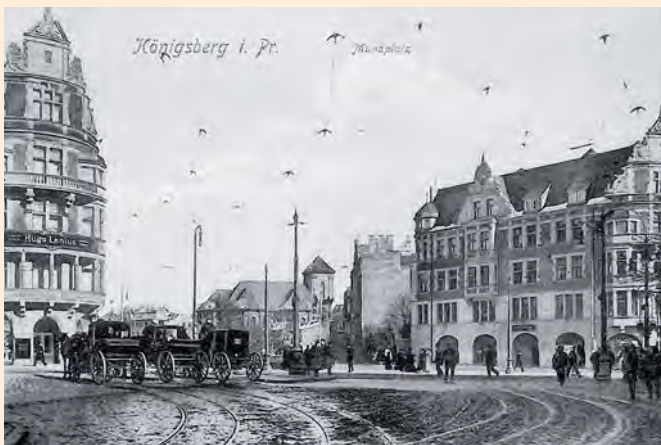
Königsberg: Münzplatz mit Pferdekutschen und Blick auf die Burgkirche, um 1910