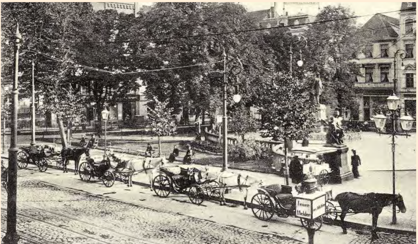
Königsberg: Kutschen am Kaiser-Wilhelm-Platz, um 1905