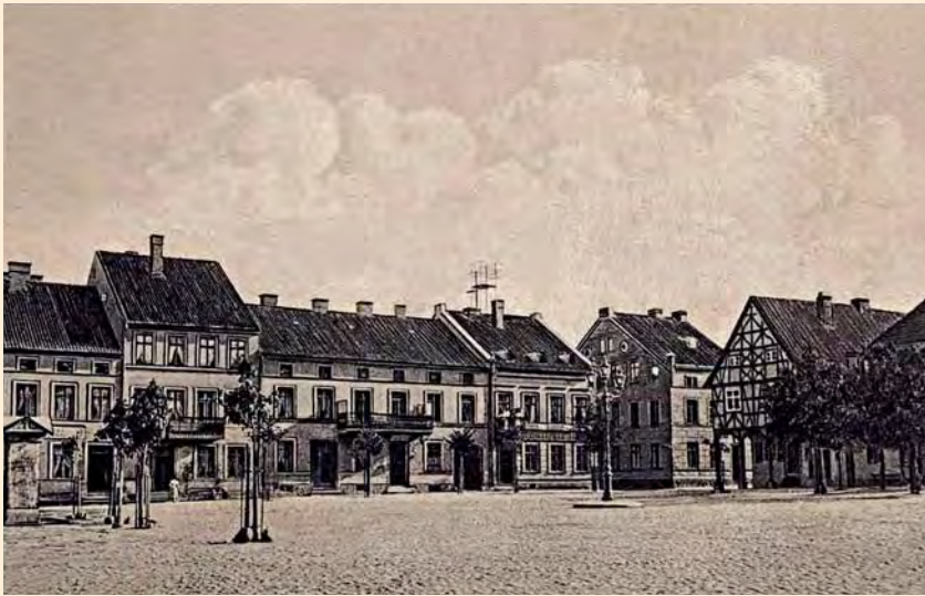
Friedland: Der Markt, um 1905