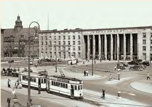
Königsberg: Nordbahnhof, um 1930