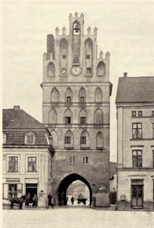
Barteinstein: Das Heilsberger Tor, um 1905