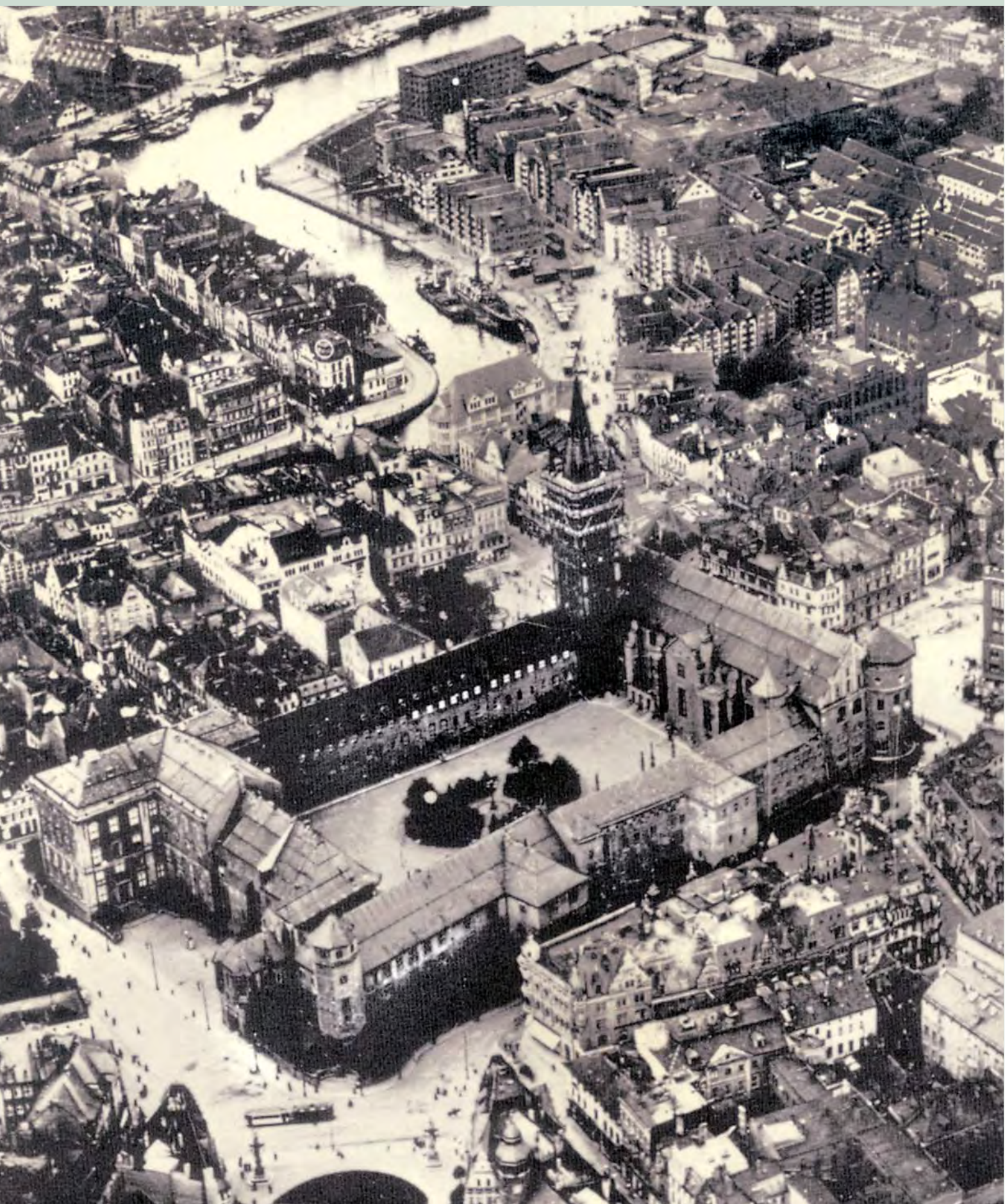
Königsberg: Luftbild, um 1925