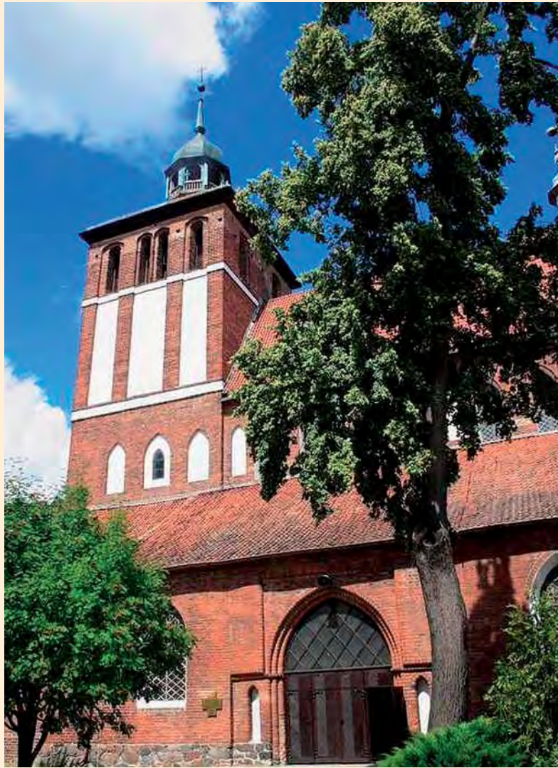
Bartenstein: Die Johannes-Kirche im Jahr 2008