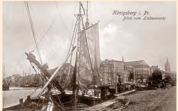
Königsberg: Blick auf den Pregel vom Lindenmarkt, links das Hundegatt, um 1906