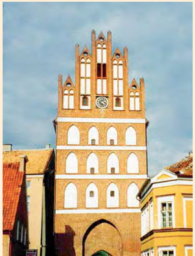
Bartenstein: Am Heilsberger Tor