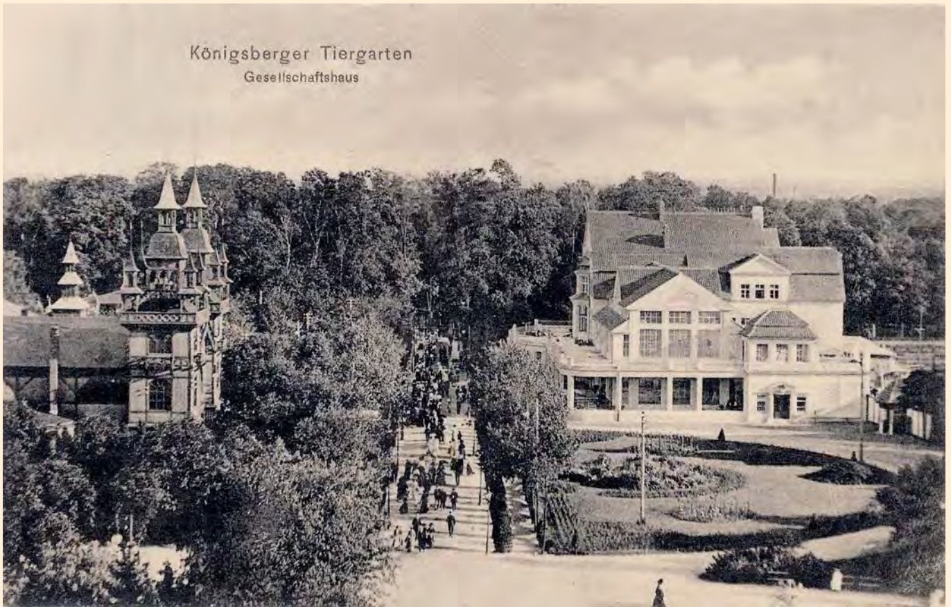
Königsberger Tiergarten Gesellschaftshaus