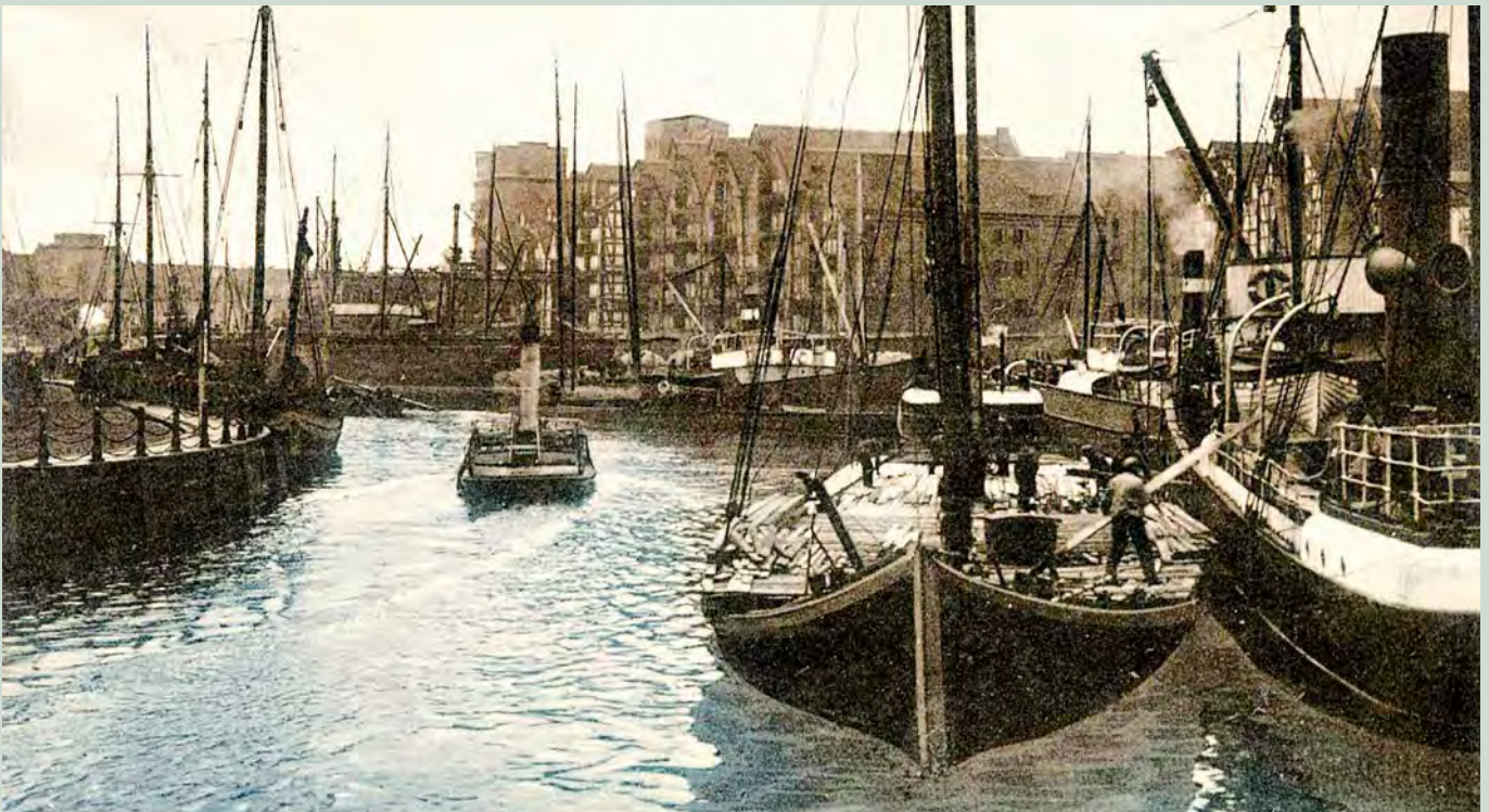
Im Hafen von Königsberg, um 1910

Die Albertus-Universität Königsberg wurde 1544 von Herzog Albrecht von Brandenburg-Ansbach gegründet. Sie war nach der Philipps-Universität Marburg die zweite protestantische Universität.