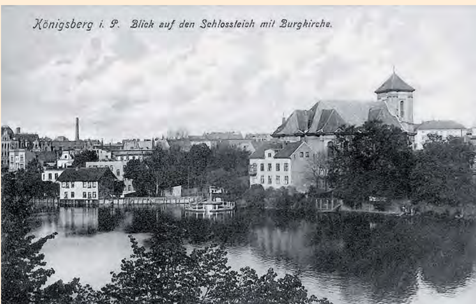
Königsberg: Blick auf den Schlossteich, um 1910