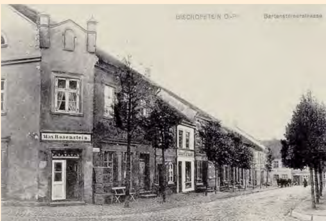
Bischofstein, Kreis Bartenstein: Die Bartensteiner Straße, um 1900