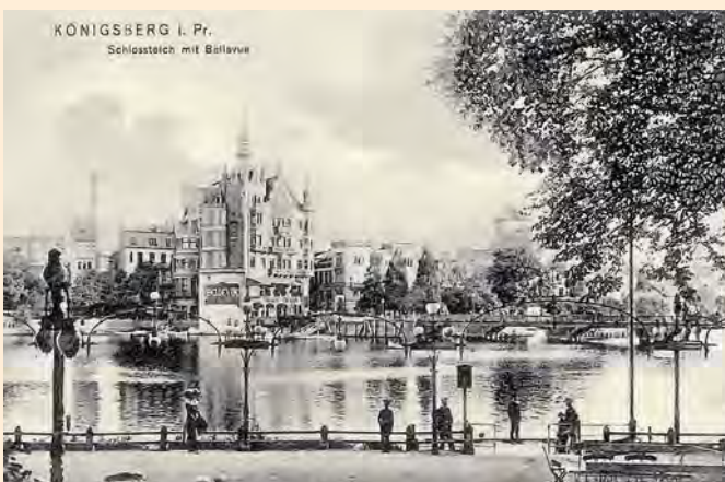
Königsberg: Schlossteich und Café Bellevue am östlichen Ende der Schlossteichbrücke um 1906. Das Café war ein prächtiger Gründerzeitbau nicht weit von der Königsberger Stadthalle entfernt.