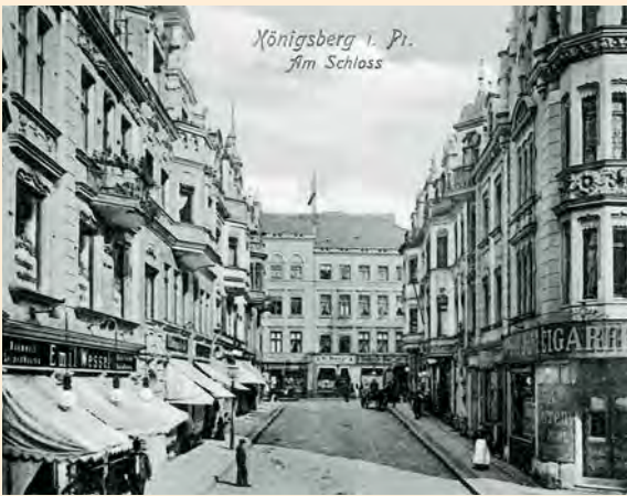
Königsberg: Die Straße „Am Schloss“