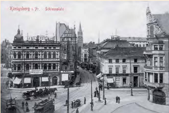
Königsberg: Münzplatz und Junkerstraße/Ecke Münzstraße, um 1905