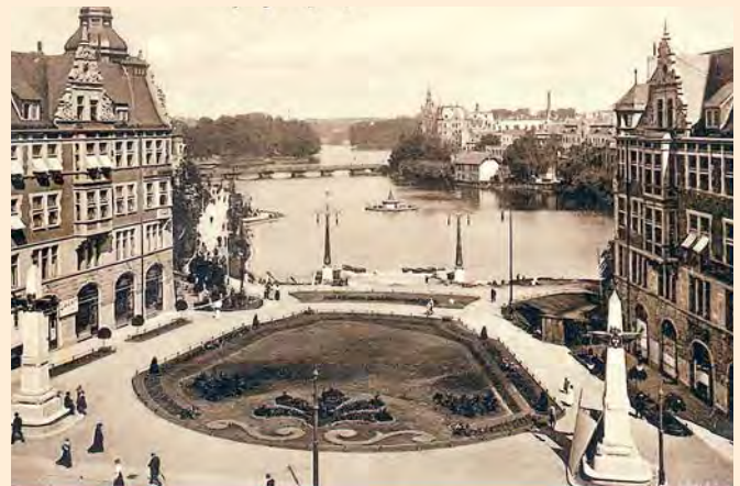
Königsberg: Blick vom Schlossturm auf den Schlossteich, um 1906