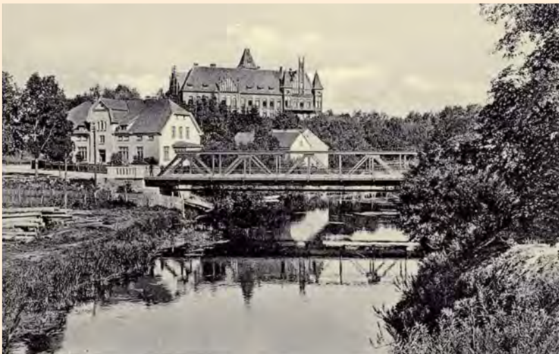
Bartenstein: Allebrücke und Kreishaus, um 1935