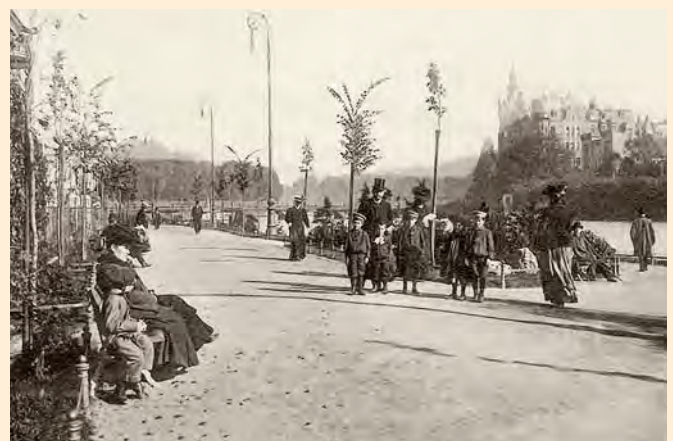
Königsberg: Spaziergänger am Schlossteich mit Uferpromenade, um 1910