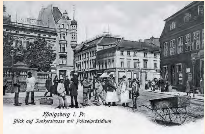
Königsberg: Münzplatz mit Junkerstraße und Polizeipräsidium, um 1910