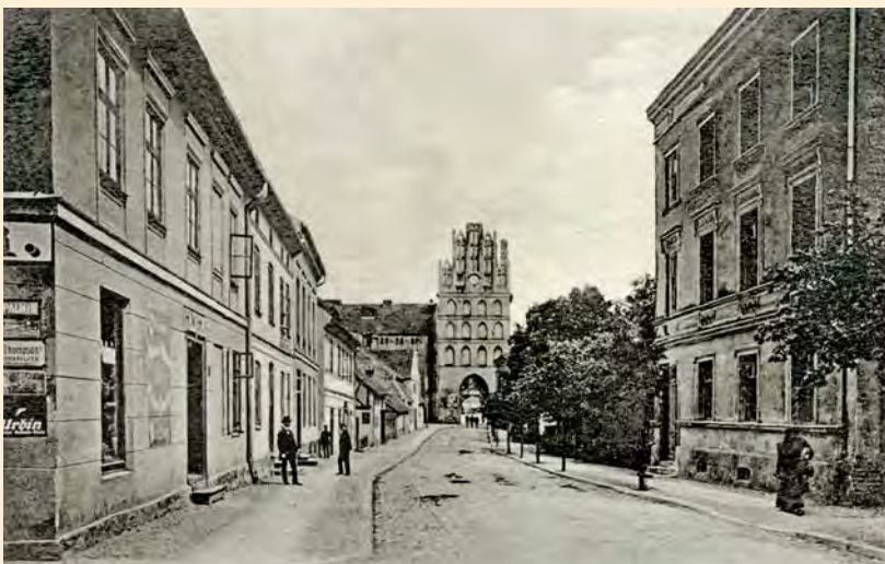
Bartenstein: Heilsberger Straße mit Heilsberger Tor, um 1905