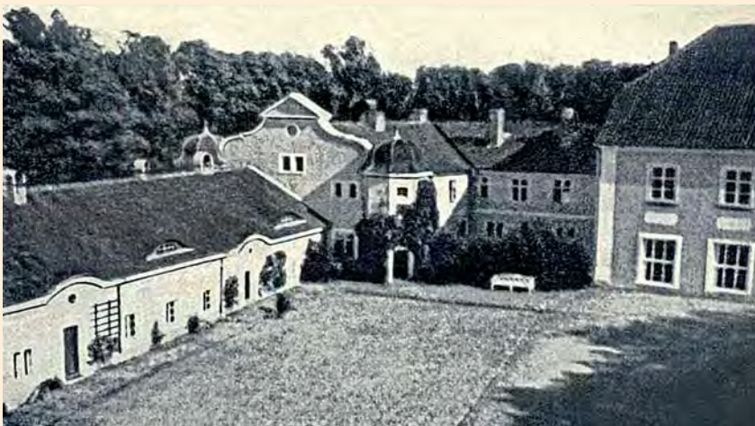
Gallingen, Kreis Bartenstein: Innenhof des Schlosses von 1589 (ältester Teil der Hofanlage), um 1925