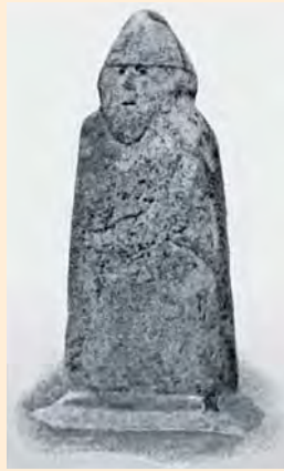
Der Bartensteiner Bartel, eine Figur aus heidnischer Vorzeit

Im nördlichsten Kreisgebiet bot die Hochmoorlandschaft des Zehlausbruchs seltener Fauna und Flora eine Heimat.