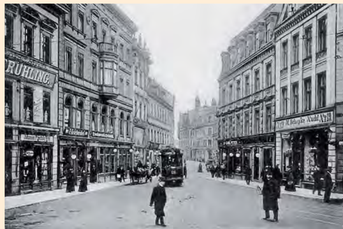
Königsberg: An der Einmündung der Junkerstraße zur Poststraße, um 1910