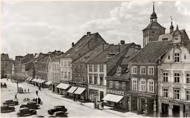
Bartenstein: Ansicht vom Marktplatz in Richtung Norden im Jahr 1914