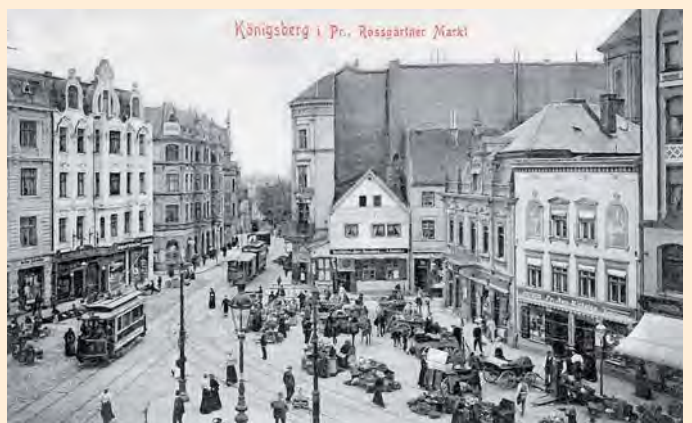
Königsberg: Marktstände und Straßenbahnen am Rossgärter Markt, um 1914