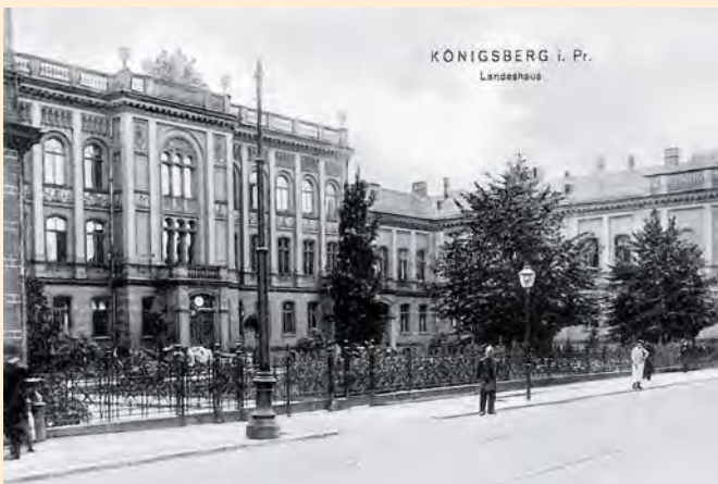
Königsberg: Das Landeshaus, um 1906