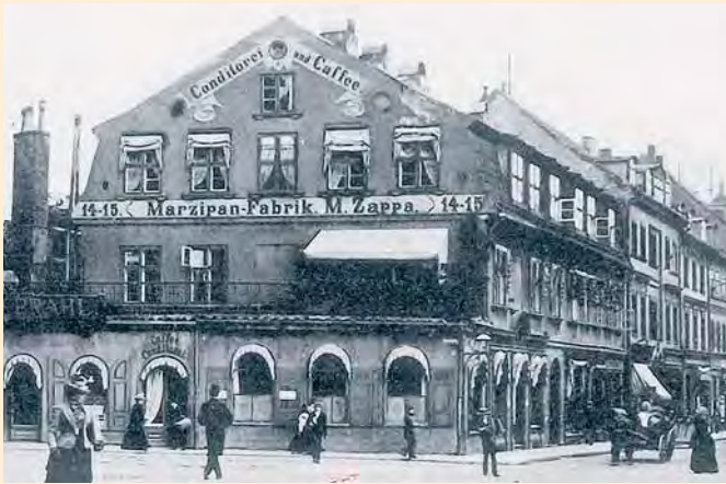
Königsberg: Schlossplatz und Französische Straße mit Café und Marzipanfabrik, um 1910