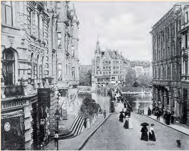
Königsberg: Die Große Schlossteichstraße mit Brücke, um 1910