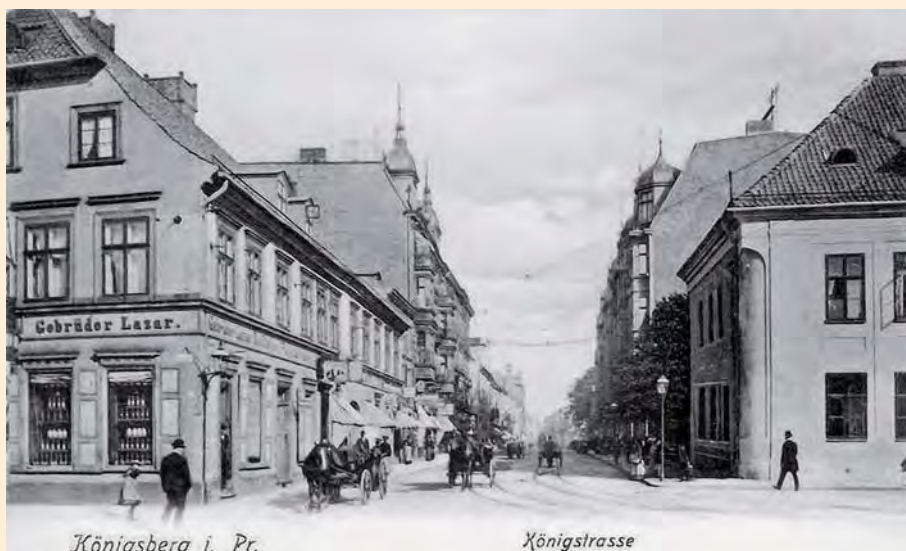
Königsberg: Die Königstraße mit Pferdefuhrwerken, um 1910