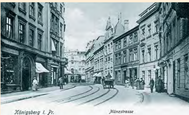
Königsberg: Blick in die Münzstraße