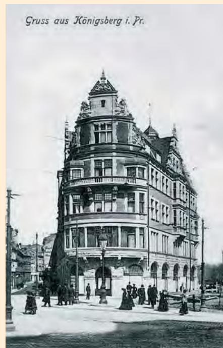
Königsberg: Münzstraße/Ecke Münzplatz, um 1900