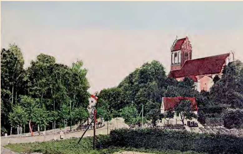
Domnau, Kreis Bartenstein: Die Protestantische Kirche, um 1905