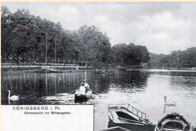
Königsberg: Bootsfahrt auf dem Schlossteich mit Blick auf den Börsengarten, um 1910