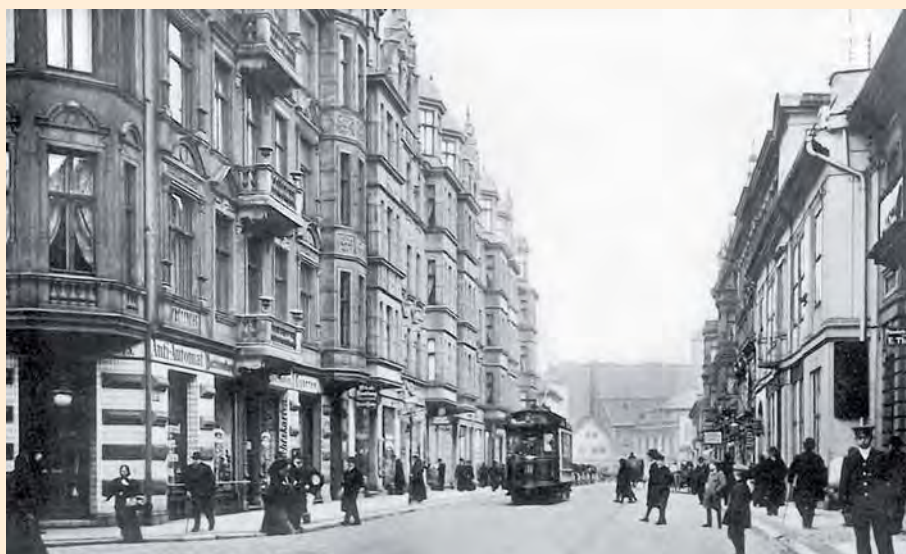
Königsberg: Die Königstraße mit der Straßenbahn