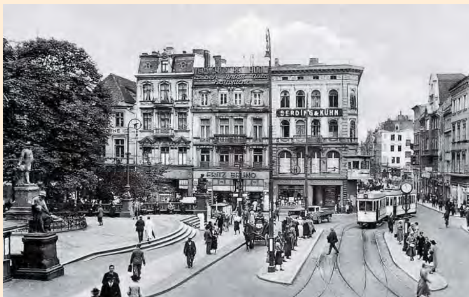
Königsberg: Das Bismarck-Denkmal auf dem Kaiser-Wilhelm-Platz im Jahr 1938. Es wurde am 1. April 1901 feierlich enthüllt. Das Denkmal stammt vom Bildhauer Friedrich Reusch, der auch sieben Jahre zuvor das in Sichtweite stehende Kaiser-Wilhelm-I.-Denkmal geschaffen hatte.