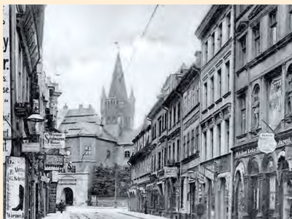
Königsberg: Die Französische Straße mit Schloss im Hintergrund, um 1910