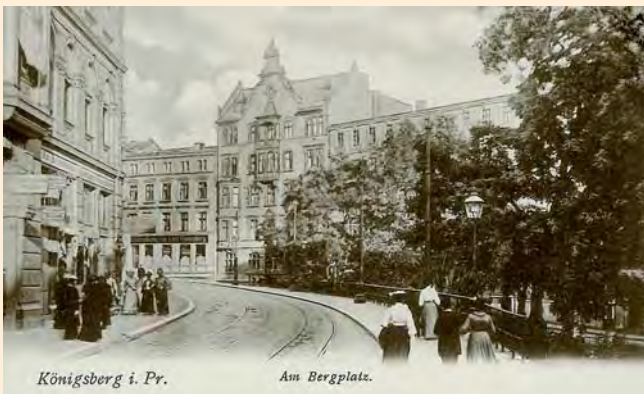
Königsberg: Straßenbahnhaltestelle am Bergplatz