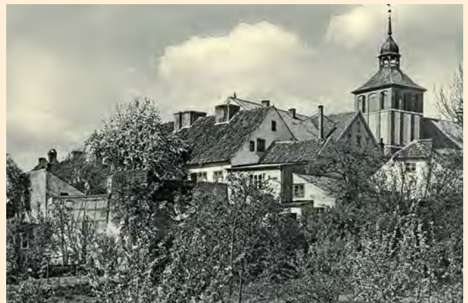
Bartenstein: Ansicht von Südosten mit Stadtkirche, 1942