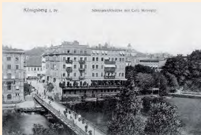
Königsberg: Schlossteichbrücke mit Café Metropol, 1906