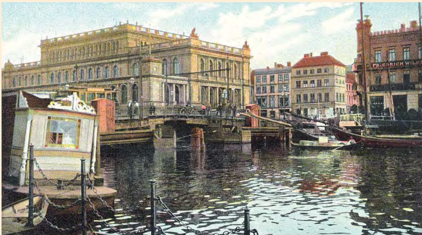
Königsberg: Die Börse am Alten Pregel mit Grüner Brücke. Das Gebäude befindet sich am südlichen Ufer des Alten Pregel gegenüber der Dominsel im Zentrum Königsbergs.