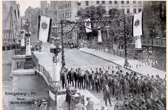
Königsberg: Die Einweihung der Grünen Brücke im Jahr 1907. Von der Vorderen Vorstadt-Straße gelangte man über die Grüne Brücke auf die Langstraße der Kneiphof-Insel im historischen Zentrum Königsbergs. Die Grüne Brücke war eine Klappbrücke mit zwei Klappteilen, die mit rund zehn Metern den Pregel überspannte. Sie hat den Zweiten Weltkrieg nicht überstanden.