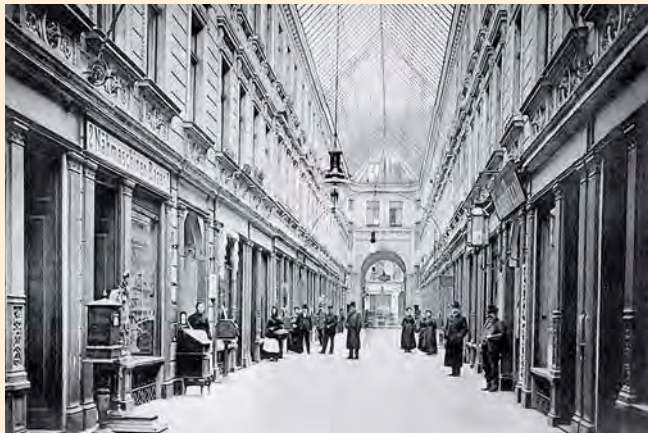
Königsberg: Die große Einkaufspassage mit Nähmaschinenbasar, um 1910