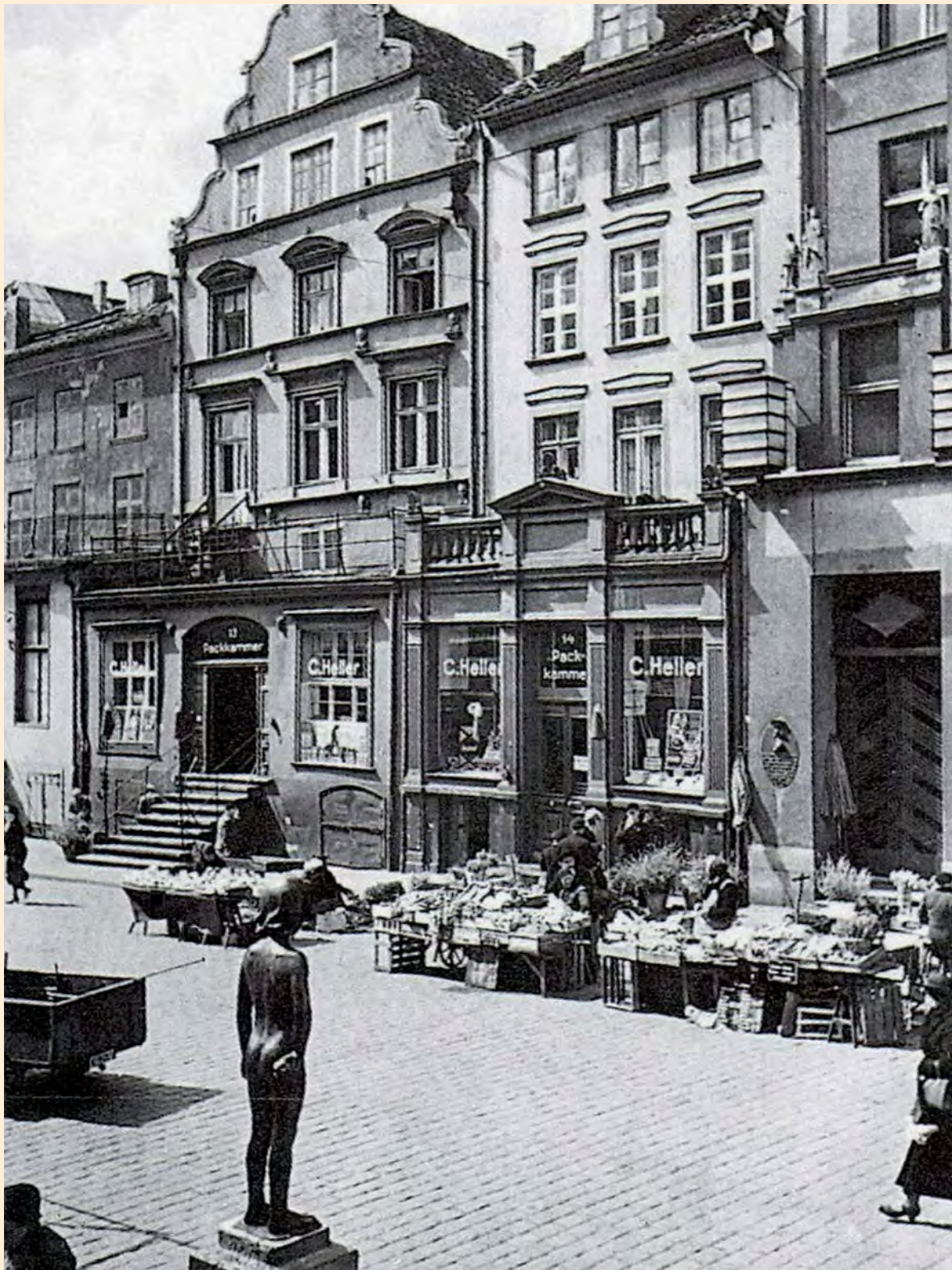
Königsberg: Der Altstädtische Markt, unweit des Kaiser-Wilhelm-Platzes, mit seinem kleinstädtischen Charakter zählte zu den schönsten Plätzen Königsbergs