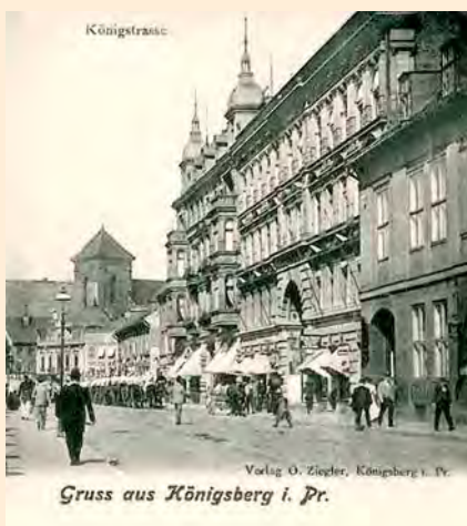
Königsberg: Königstraße an der Passage mit Militärparade, um 1900