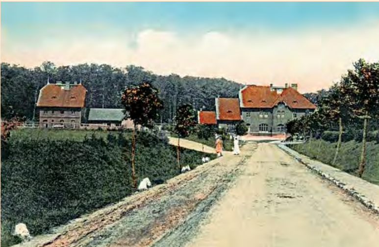
Domnau, Kreis Bartenstein: Straße und Fußweg zum Bahnhof, um 1910