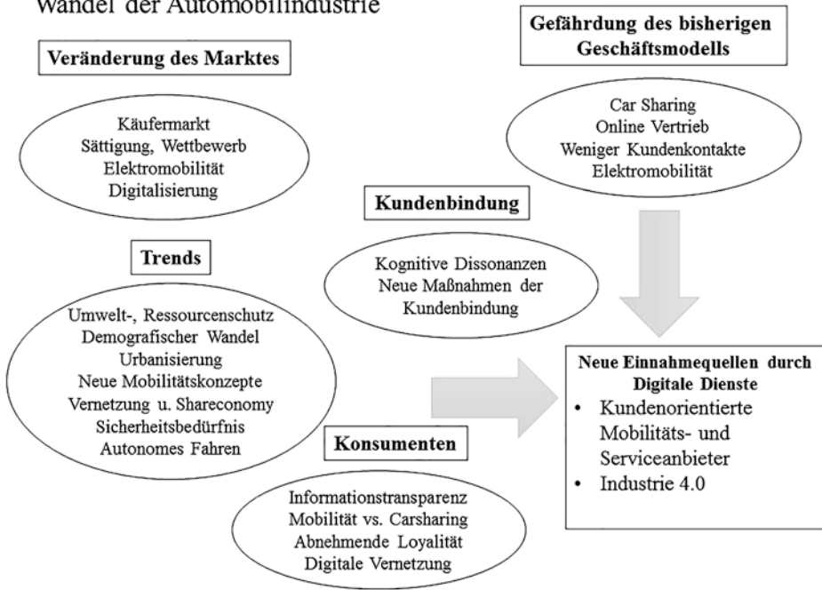
Abb. 2.1 Wandel in der Automobilindustrie