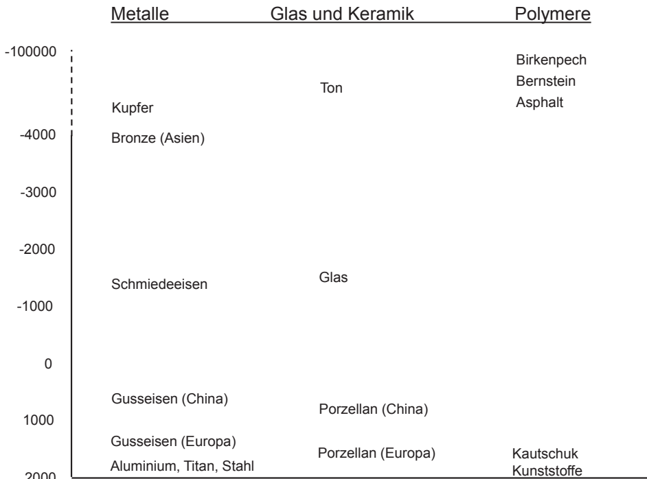
Bild 1.2 Historische Entwicklung der Werkstoffe

hunderts überwiegend mit der Entwicklung von Farbstoffen befasst, um immer teurer werdende Naturprodukte (wie Indigo) zu ersetzen. Dabei bildeten zufällige Entdeckungen bei der Suche nach neuen Farbstoffen die Grundlagen der heutigen pharmazeutischen Chemie. Anfang des 20. Jahrhunderts begann außerdem die gezielte Entwicklung von Synthetikgummen mit dem Ziel, den immer knapper und gleichzeitig teurer werdenden Naturkautschuk zu ersetzen. Thermoplaste und Duroplaste spielten bis in die ersten Jahrzehnte des zwanzigsten Jahrhunderts nur eine untergeordnete Rolle. Aufbau und Struktur polymerer Werkstoffe wurden erstmals 1920 durch Hermann Staudinger erklärt. Seine Arbeiten wurden aber erst einige Jahre später nach Vorliegen entsprechender Röntgenstrukturuntersuchungen allgemein anerkannt, was die systematische Entwicklung neuer polymerer Werkstoffe erst ermöglichte. Die bis dahin entwickelten synthetischen Polymere basierten im Grunde genommen auf Vermutungen und experimentellen Erfahrungen. In einigen Fällen führte auch der Zufall zur Entwicklung neuer Polymere (Bild 1.2).