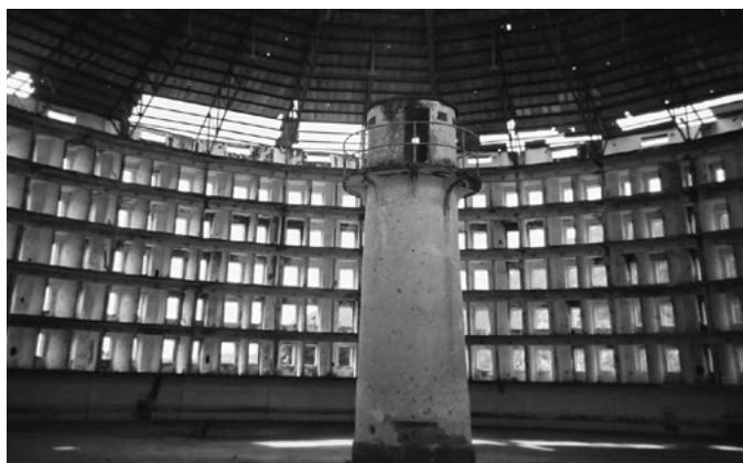
2. Kubanisches Gefängnisgebäude

Diese »geniale« Idee ist viel später tatsächlich umgesetzt worden, und so kann ich meine Schilderung viel kürzer machen. Sehen Sie im folgenden Bild einen realen Bau: