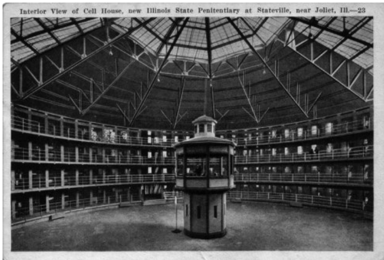
3. Amerikanische Postkarte

auf den neueren Bildern nur heller – die hier gezeigte Postkarte ist ja schon sehr vergilbt.