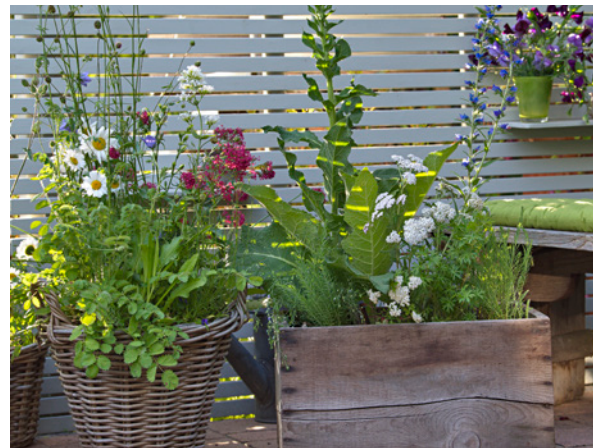
Wenn es die Statik zulässt, wähle ich gern große Gefäße. Eine gute Versorgung der Pflanzen mit Wasser und Nährstoffen gelingt darin besser als in kleinen Töpfen.