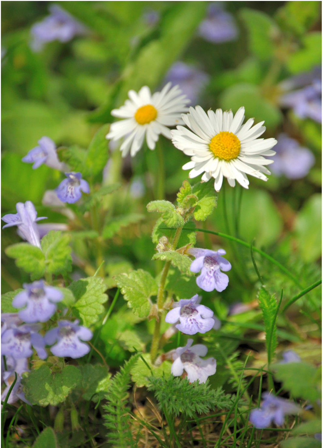
Gänseblümchen und Gundermann - ein paar Blüten davon kommen auf meinen Salat.