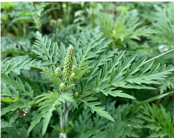
Vorsicht: Das Beifußblättrige Traubenkraut, auch unter dem Namen Ambrosie bekannt, kann allergische Reaktionen auslösen. Zum Jäten braucht man Handschuhe und Maske.

Pflanzgefäße müssen sicher stehen und dürfen auch bei starkem Sturm nicht von Dä-