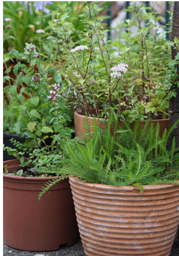
Auf einem Südbalkon gedeihen Dost und Schafgarbe, wenn sie bei Hitze regelmäßig einen Schluck Wasser bekommen.

Folgende Fragen können helfen: Was möchte ich ernten? Soll es üppig blühen? Soll es duften? Soll es schön aussehen? Möchte ich Heilpflanzen auf meinem Balkon? Will ich möglichst viel Tiere beobachten? Sie haben alles mit „Ja“ beantwortet? Dort, wo man intensiv erntet, kann es nicht gleichzeitig immer üppig blühen und wunderschön aussehen, aber es gibt ja in Ihrem gemütlichen Wildkräuter-Paradies hoffentlich mehrere Kübel. Und noch etwas schränkt die Wünsche empfindlich ein: Wenn Sie einen Nordbalkon haben, werden Sonnenpflanzen sich nicht wohlfühlen, auf einem Ost- oder Westbalkon gedeihen sie eher. Ein Südbal-