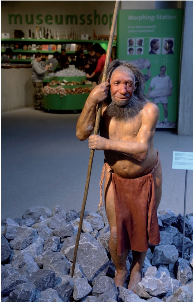
Sympathisches Museumsstück: Anthropologen und Archäologen zeichnen heute ein lebensnahes Bild des Neandertalers; Rekonstruktion im Neanderthalmuseum Mettmann.