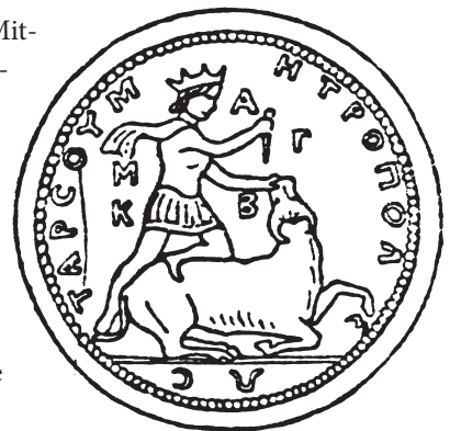
▼ Abb. 1: Münze des Kaisers Gordian III. (238–244). Mithras als Stiertöter

Auch in Kilikien prägte die Metropolis Tarsos in der Mitte des 3. Jahrhunderts der Kaiserzeit Münzen mit dem kanonischen Motiv der Tötung des Stieres durch Mithras (CIMRM 27; Abb. 1). Diese Darstellung des Gottes weicht von derjenigen in den Mithräen ab; der Gott trägt hier eine Strahlenkrone und ist bis auf einen Schurz nackt. Plutarch berichtet über diese Region, dass die aus der Gegend stammenden berühmten kilikischen Seeräuber als erste geheime Mitra-Zeremonien eingeführt hätten (Pompeius 24, 5); dies mag sein, doch beweist es für die Entstehung des römischen Mysterien-Kultes nichts.