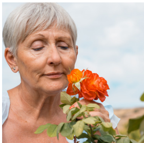
Die Wahrnehmung von Düften verändert sich über die Zeit.

Ist der Geruchssinn gestört, kann das ein schwerer Einschnitt im Leben sein. Menschen, die durch einen Unfall oder eine Krankheit ihren Geruchssinn verloren haben, leiden meist sehr darunter. Auch weil der Geruchssinn eng mit dem Geschmackssinn verbunden ist. So schmeckt alles fad, wenn wir nicht gut riechen können. Das kennen Sie vielleicht von einer Erkältung,