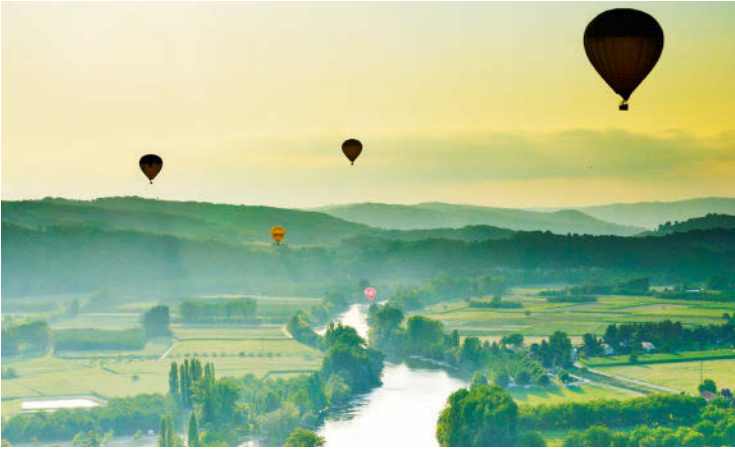
Allez-y: leicht und lautlos auf zur Fahrt nach Wolkenkuckucksheim