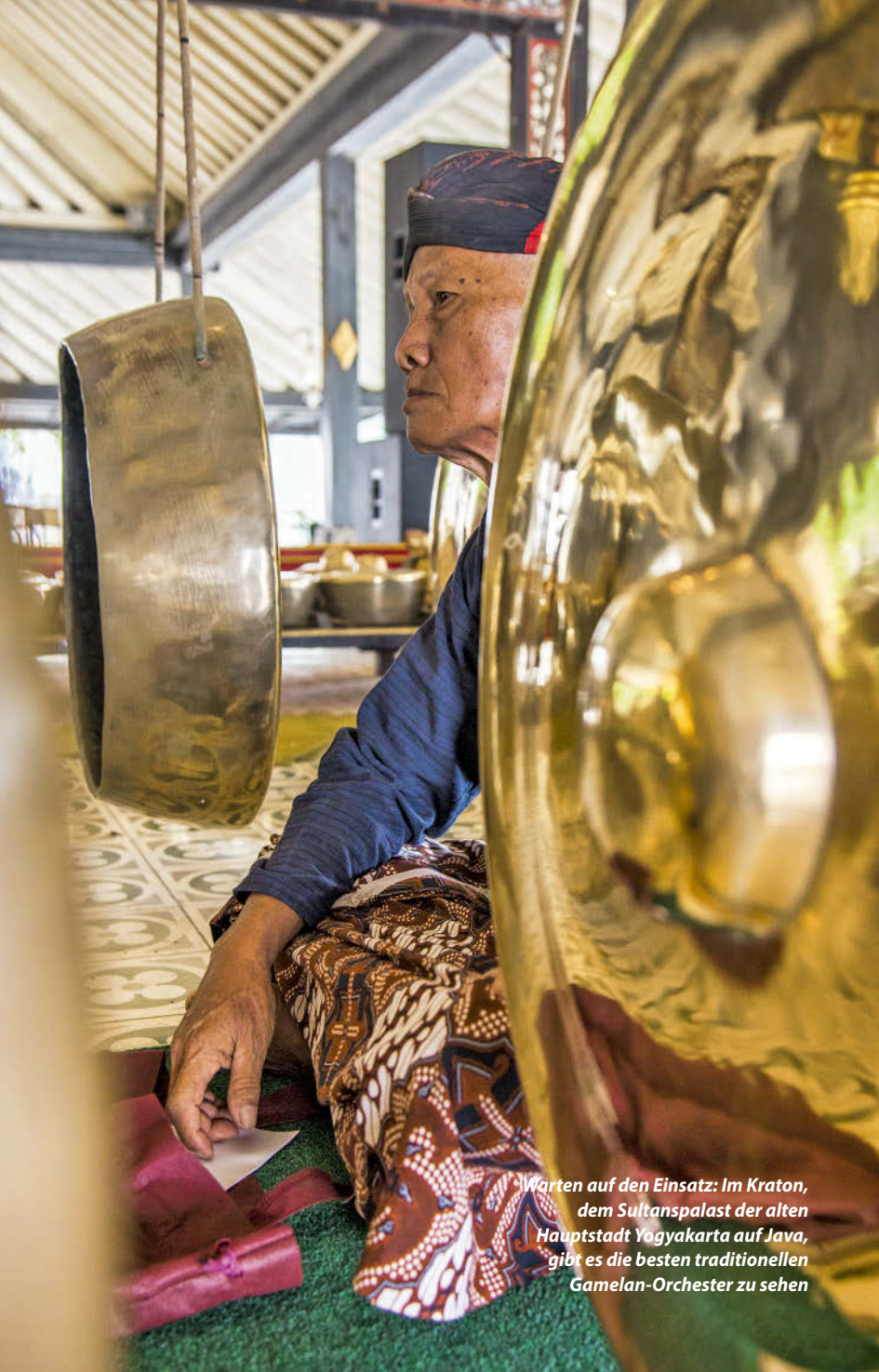
Warten auf den Einsatz: Im Kraton, dem Sultanspalast der alten Hauptstadt Yogyakarta auf Java, gibt es die besten traditionellen Gamelan-Orchester zu sehen