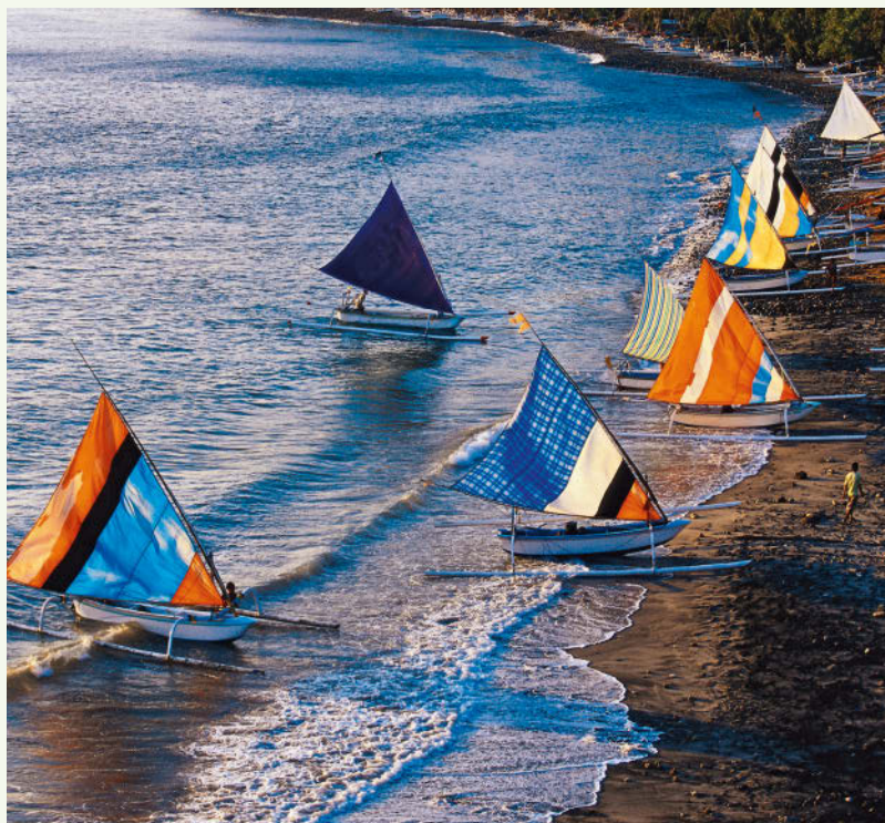
Bei knapp 55 000 km Küstenlänge findet jedes Fischerboot einen Strandparkplatz

met-Restaurant alles, was zu einem genussreichen Urlaub gehört. Im Wellness-Paradies Bali sind in den letzten Jahren inselweit zahlreiche Spas entstanden – in renommierten Hotels oder als Tages-Spas –, in denen sich die Gäste von Kopf bis Fuß verwöhnen lassen können. Zum Angebot vieler Hotels gehören zudem Yoga und Meditation.