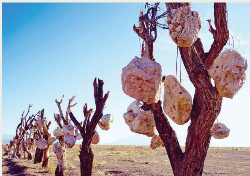
Land-Art als Protest gegen akuten Wassermangel: der »Steingarten« unweit von Sirjan

das Auge und gut für das Mikroklima sie sein mag, Wasser ohne Ende. Als Menetekel erscheint das Schicksal des Orumiye-See im äußersten Nordwesten. Dieses ehemals größte Binnengewässer des Landes ist – ähnlich wie der Aralsee in Usbekistan, , aber weit weniger beachtet – innerhalb eines Jahrzehnts um 95 % zu einer Schlamm- und Salzwüste geschrumpft (s. S. 213).