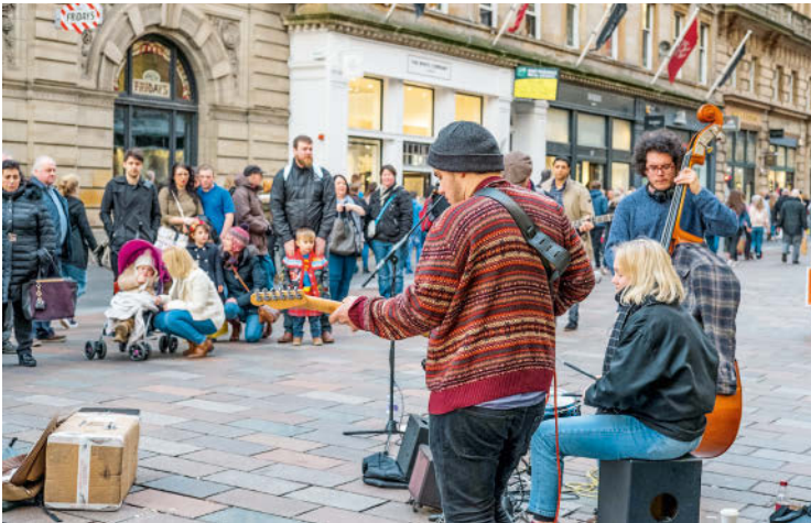
Straßenmusik in der Fußgängerzone – in der Buchanan Street werden die Passanten oft gut unterhalten.

und trendigen Bistros in der Merchant City, in Finnieston oder in Hillhead – die Zeiten von Fish’n’Chips sind einer kreativ interpretierten schottischen Küche gewichen. Regionale Zutaten sind angesagt – vom Angusrind und Lammfleisch bis zu Meeresfrüchten. Dazu kommen die hervorragenden exotischen Spezialitäten der indischen Küche, die in Glasgow besonders stark vertreten ist. Auch selbst gebräutes Craft Beer wird immer beliebter und der Aufschwung der Whisky-Industrie hat auch den Clyde erreicht. Aber die klassischen Fish’n’Chips gibt es natürlich immer noch.