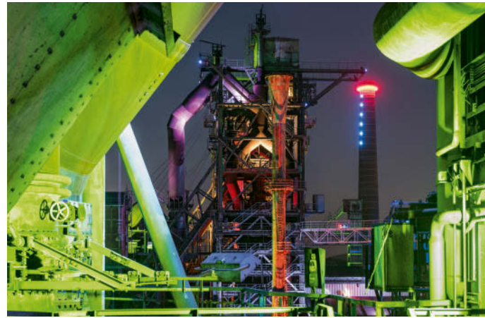
24 Illuminierter Hochofen im Landschaftspark Duisburg-Nord