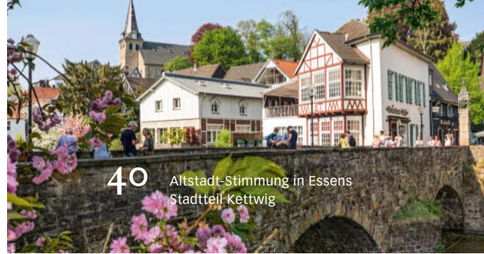
40 Altstadt-Stimmung in Essens Stadtteil Kettwig