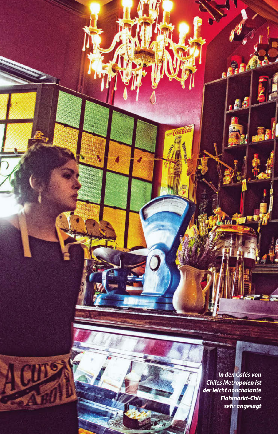
In den Cafés von Chiles Metropolen ist der leicht nonchalante Flohmarkt-Chic sehr angesagt