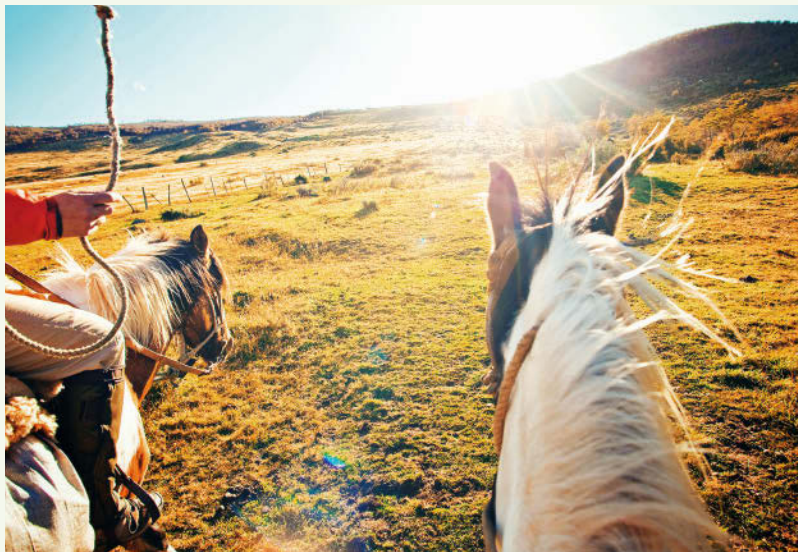
Chiles Süden ist ein Dorado für Reiter

Anbaugelände wuchs auch der Ruhm, sodass das Verkosten chilenischer Weine ein alleiniges Reismotiv bilden kann. Der Besuch von Weingütern lässt sich aber auch leicht von Santiago aus als Tagestrip organisieren. Wer mehr Tage opfert, zum Beispiel für die Valles Colchagua oder Casablanca, lernt nebenbei ein Stück der bäuerlichen Identität Chiles kennen.