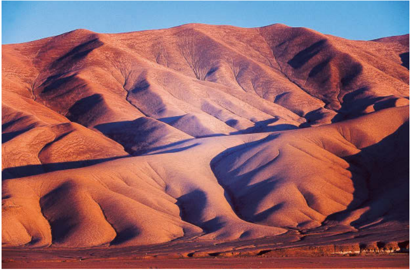
Nein, dies ist keine Ansicht der Sahara, sondern die Atacamawüste im schwindenden Sonnenlicht

turschutz auf den Plan rief. Mittlerweile gibt es wieder rund 27 000. Dieses Glück hatte die Chinchilla nicht. Ursprünglich hier beheimatet, ist sie längst wegen ihres ausgefallenen Pelzkleides ausgerottet worden. An den Küsten leben unter anderem Pelikane, Kormorane und Robben.