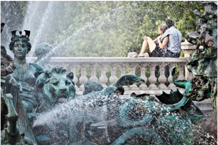
Aufenthaltsort für romantische Stunden und für Kühlung in der Sommerhitze ist der Doppelbrunnen zu Füßen des Monument aux Girondins.

In zweiter Häuserreihe springt am Quai des Chartrons ein Glaspalast ins Auge. Bis 1992 entstand die Cité Mondiale 14 (18, parvis des Chartrons), u. a. als Kongresszentrum. Der gläserne Bau beherbergt Geschäfte, Restaurants und das komfortable Hotel Mercure Cité Mondiale, dessen Gäste – und auf Anfrage auch Zaungäste – von der Frühstücksterrasse einen schönen Blick auf Altstadt und Garonne genießen.