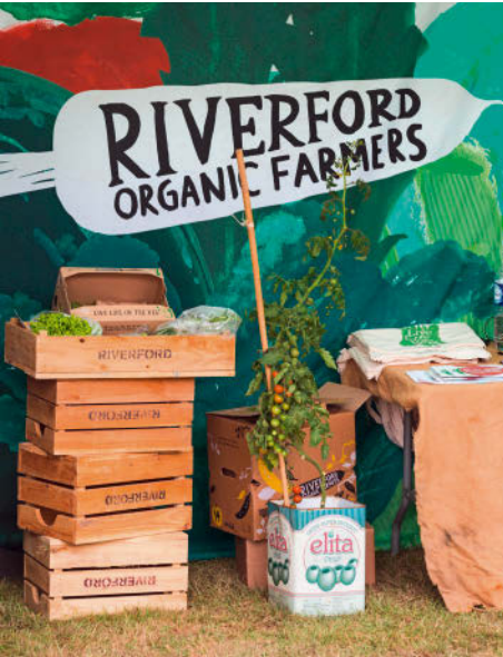
Bio-Stand auf der New Forest & Hampshire County Show in Brockenhurst im Juli

Nicht immer hat man das Glück, passend zu einem dieser Großereignisse vor Ort zu sein. Ein kleiner Trost können die bescheideneren Flower Shows oder Village Fairs sein. Dort wetteifern die Bewohner einer Gegend in charmannten Wettbewerben, beispielsweise um die größten Möhren und Radieschen, um fünf formschöne, auf einem Teller arrangierte Tomaten, um makellose Dahlien und Rosen oder um Kuchen und hausgemachte Erdbeermarmelade – wobei nicht selten ein Mitglied des Women's Institute, der englischen Landfrauenvereinigung, die heiß begehrte Trophäe abräumt. Anderswo präsentieren die Damen der Pfarrei Strick- und Häkelarbeiten und ihre Ikebana-Kunst. Auch der Kaninchenzüchterverein darf nicht fehlen. Und beim Geschicklichkeitsparcours für Familienhunde sind lautes Schreien und Lachen garantiert.