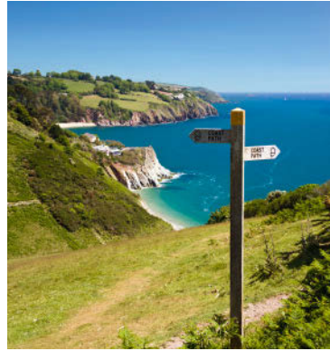
Verlaufen schwer gemacht – entlang des Coast Path weisen zahlreiche Schilder den Weg.

Natürlich kann man eine leicht zu bewältigende Tagesetappe aussuchen und abends mit dem Bus zum Ferienort zurückkehren. Auch sind viele schöne Rundwege mit dem Küstenpfad verbunden (Informationen vor Ort und über die Websites auf der linken Seite). Wohl liegt die große Auswahl daran, dass die Briten in ihrer Freizeit gerne zu Fuß unterwegs sind – nicht zuletzt deshalb, weil so viele einen Hund besitzen. Ein dichtes Netz von Wegen und Pfaden