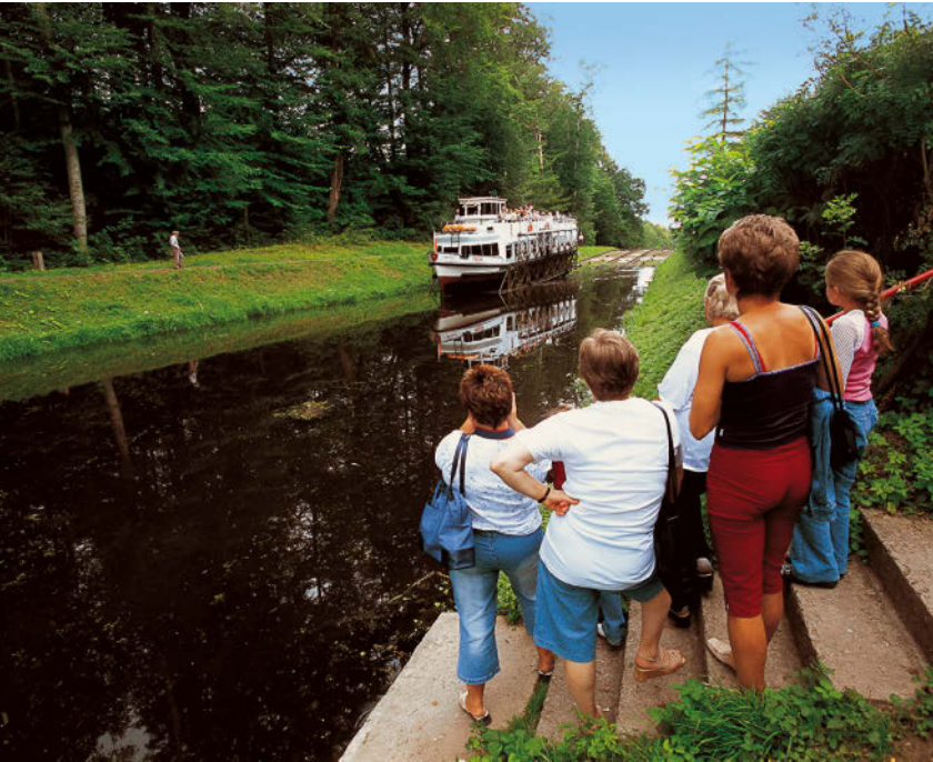
OBEN: Am Oberlandkanal sind Schaulustige keine Seltenheit.