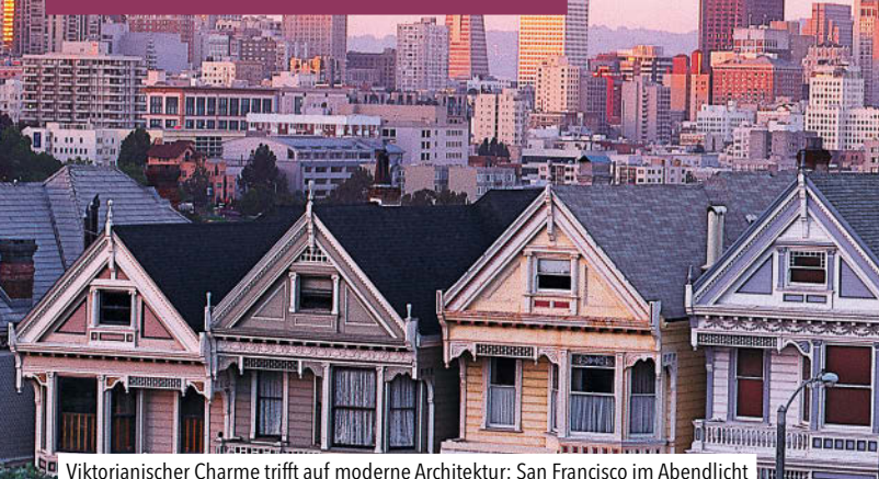
Viktorianischer Charme trifft auf moderne Architektur: San Francisco im Abendlicht

Amerikas Westen ist seit jeher ein Land der Verheißung. Früher lockten Gold und freies Land die Siedler. Heute kann man in grandiosen Landschaften, bekannt aus ungezählten Roadmovies und Western, fabelhaft biken, surfen oder Ski fahren und Traumstädte wie San Francisco oder Las Vegas erleben. Ein ganz persönliches Abenteuer verspricht der Westen auch heute noch.