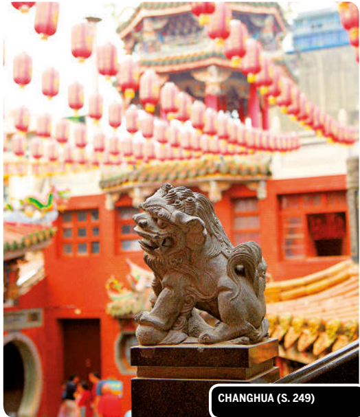
CHANGHUA (S. 249)