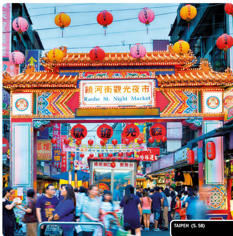
TAIPEH (S. 58)