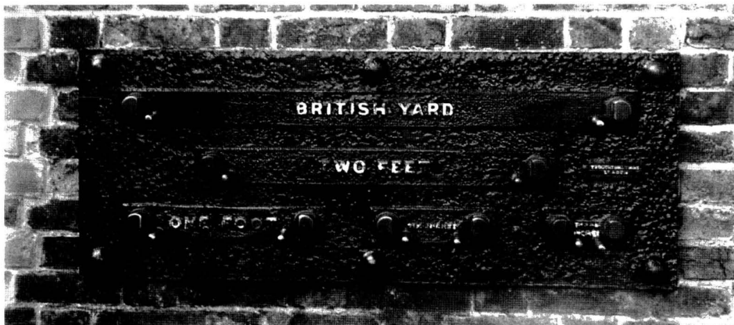
The standard Imperial units of length, Greenwich

Bei Höhenmaßen sagt man in der Umgangssprache meist "foot" statt "feet". Vor Maß-, Gewichts- oder Zeitangaben steht der unbestimmte Artikel: The curtains cost £29 a yard. The rent is £120 a month. He drives at 40 miles an hour. Natürlich ist das Dezimalsystem im Kommen. Also: metre (AE: meter), centimetre, millimetre, kilometre; litre (AE: liter), gram(me), kilogram(me). Auch in der Schreibweise gibt es Unterschiede zum Deutschen: Anstelle von 2,54 schreibt man 2.54 und man spricht two point five four. Für Null sagt man in diesem Fall "nought": nought point nine one.