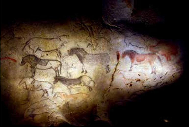
Abb. 1.1: Höhlenmalerei, ca. 14.000 Jahre alt, in der Höhle von Ekain im spanischen Baskenland