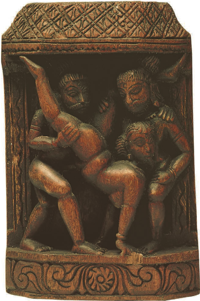
Indisches Tempelrelief, Nachbildung, 19. Jh. Indien.