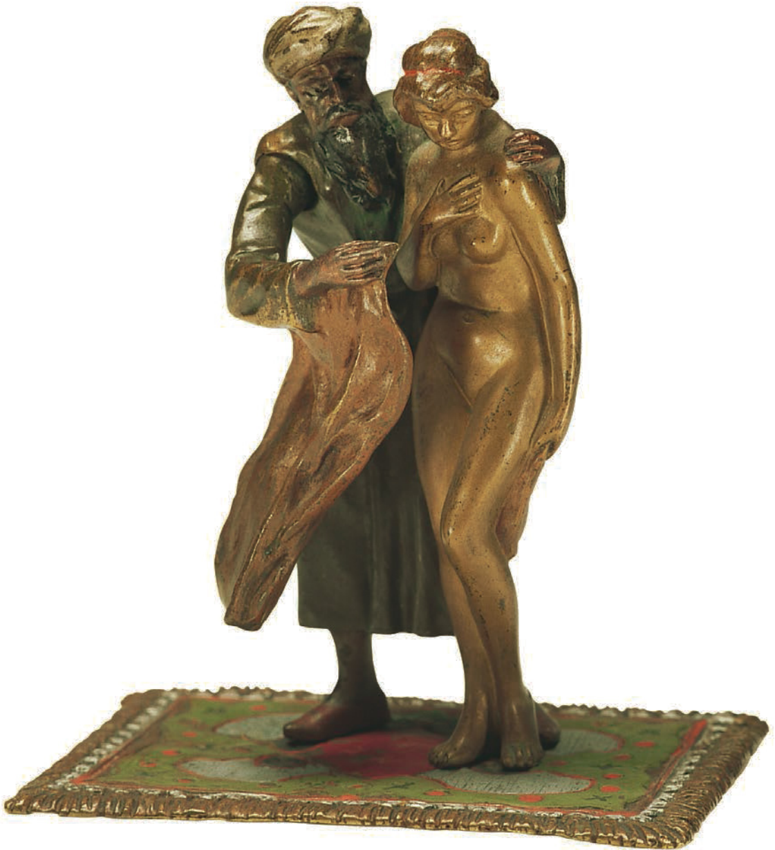
Arabischer Sklavenhändler, um 1910. Bronze.