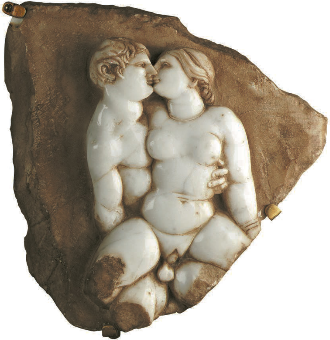
Liebespaar. Nach griechischem Marmorrelief.