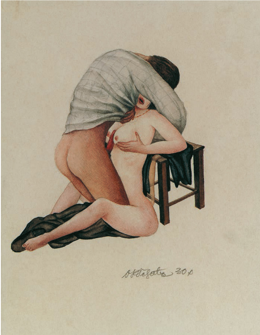
Otto Rudolf Schatz , Busenfick . Aquarell.