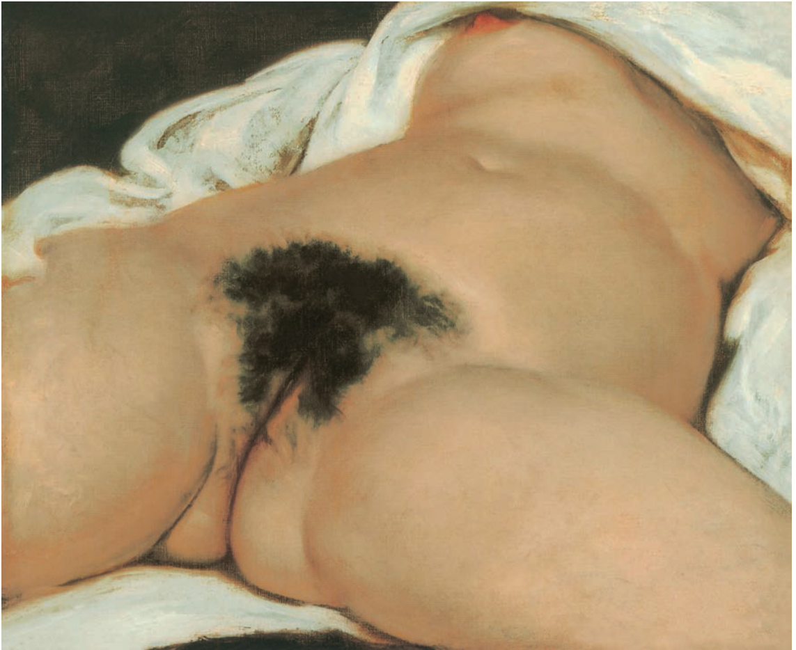
Gustave Courbet , L'Origine du Monde (Der Ursprung der Welt) , 1866. Öl auf Leinwand, 46 x 65 cm. Musée d'Orsay, Paris.