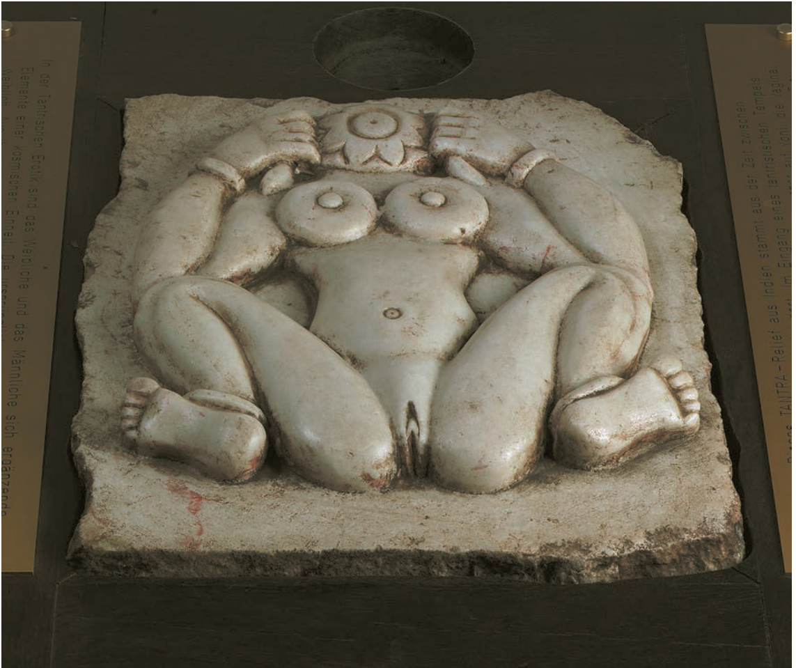
Indisches Tantrareief, 11.-13. Jh. Marmor.