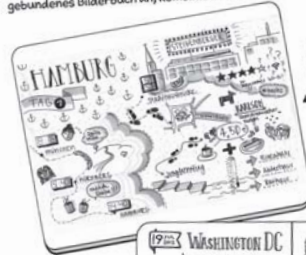
Reise-Sketchnotes von Frau Hillie, die auf ihrer Reise von München nach Hamburg entstanden sind.

Für persönliche Reisen erstellen Sie Sketchnotes von Orten, Sehenswürdigkeiten, Höhepunkten und Geschichten, die Sie von einem Urlaub in Erinnerung behalten möchten. Teilen Sie Ihre finalen Sketchnotes oder legen Sie davon ein gebundenes Bilderbuch an, kombiniert mit Fotos Ihrer Reise.