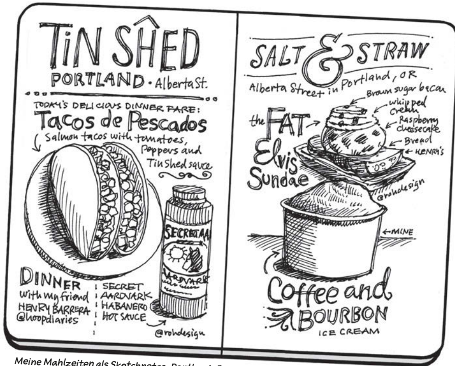
Meine Mahlzeiten als Sketchnotes, Portland, Oregon

Als altgedienter Designer verwende ich Sketchnotes zur Ideenfindung und zum täglichen Ideen-Mapping. Seit Jahren erstelle ich auf Reisen und zu besonderen