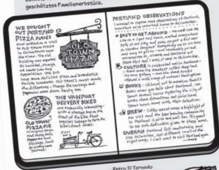
Ugmonk-Reiseskizzenbuch in grünem Leder Retro SI Tornado Stealth Rollerball®-Stift

Eins meiner Lieblingsobjekte ist ein handgemachtes Lederskizzenbuch, das ich verwendet habe, um Sketchnotes meiner Reisen nach Washington D. C. und Portland festzuhalten. Ich liebe es, wie es sich anfühlt, wenn man die Seiten füllt. Es ist eine Freude, mit meinem „Retro SI Stealth Rollerball“-Stift zu zeichnen und zu schreiben. Mein grünes Reisebuch ist schon heute ein geschätztes Familienerbstück.