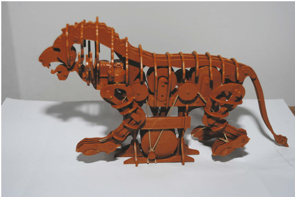
Abb. 1: Modell des Löwen von Leonardo da Vinci

Wann ist ein Computer intelligent? Wie können wir erkennen, dass ein Computer intelligent ist? Diese Fragen sind beinahe so alt wie die Computertechnik selbst. Und auch schon zu historischen Zeiten trieb die Menschen die Frage um, ob eine Maschine intelligent sein kann. Beispielsweise hat Leonardo da Vinci 1515 einen mechanischen Löwen konstruiert, den er zur Thronbesteigung des französischen Königs Franz I. gebaut hatte. Die Maschine konnte sich ein wenig bewegen und machte auf die damaligen Zuschauer einen durchaus lebendigen Eindruck.