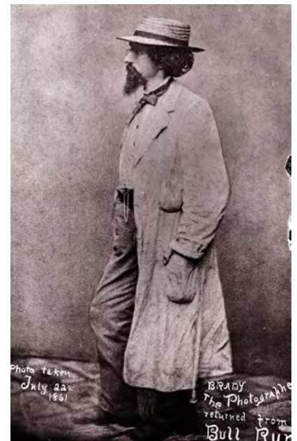
Abb. 1-10 // Mathew Brady gilt als wichtigster Fotograf des Bürgerkriegs, auch wenn viele der Bilder von seinen Mitarbeitern stammten. Sein Engagement brachte ihm jedoch kein Glück. Die hohen Investitionen für seine Bürgerkriegsbilder, mehr als 100.000 Dollar, trieben ihn in die Pleite. Er starb 1896 verarmt in New York.

Als im April 1861 die Auseinandersetzung begann, zog es Brady sofort hinaus. Er wollte nach eigenem Bekunden ein reales Bild vom Krieg schaffen. »Ich musste gehen. Ein Geist in meinen Füßen sagte, Geh! Und ich ging«, äußerte er sich später. Außerdem schickte Brady auf eigene Kosten und ohne jeden Auftrag mehr als 20 seiner Mitarbeiter in die Kämpfe. Von ihnen stammen viele der heute noch erhaltenen Aufnahmen. Im Jahr 1862 zeigte Brady in seinem New Yorker Atelier unter dem Titel »The Dead of Antietam« eine Ausstellung mit Fotografien aus der Schlacht von Antietam. Diese Bilder stammten von Alexander Gardner, der sich später von Brady trennte und ein eigenes Atelier eröffnete. Die Ausstellung hatte eine starke Wirkung. Die New York Times schrieb in einem Leitartikel vom 20. Oktober 1862: »Mr. Brady tat etwas, um die furchtbare Wirklichkeit und den Ernst des Krieges zu uns zu bringen. Zwar brachte er keine Leichen mit, um sie in unsere Vorgärten und Straßen zu legen, aber er hat etwas Ähnliches getan ...«. Wenngleich Fotos damals noch nicht gedruckt werden konnten, dienten sie als Vorlage für Holzstiche, die in Zeitschriften wie Harper's Weekly und Frank Leslie's Illustrated Newspaper in großem Umfang veröffentlicht wurden.