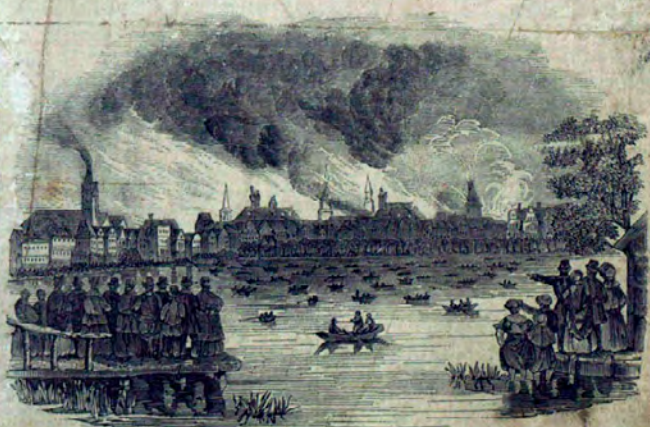
View of the Conflagration of the City of Hamburg.