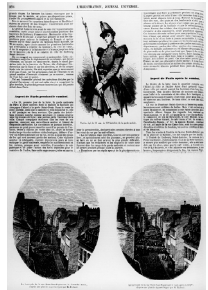
Abb. 1-4 // und Abb. 1-5 // Wahrscheinlich die ersten Nachrichtenfotos der Welt, die in einer Zeitung als Stiche erschienen: Thibaults Bilder von den Barrikaden in der Rue Saint-Maur in Paris-Popincourt. Über den Autor ist kaum etwas bekannt, vermutlich war er Amateurfotograf und lebte in diesem Viertel, dem heutigen 11. Arrondissement.

1840 wurde durch die Publikation von William Henry Fox Talbots Negativ-Positiv-Verfahren ein entscheidender Schritt zur Verbreitung der Fotografie und ihrer Rolle als Kommunikationsmittel getan. Jetzt war es möglich, Fotos zu reproduzieren und in Auflagen herzustellen. Bald wurden Fotos auch als Vorlagen für die Stiche in illustrierten Magazinen verwendet. Zum ersten Mal tat das wahrscheinlich L'Illustration am 8. Juni 1848. Sie druckten zwei Stiche nach Fotos von M. Thibault, die während der 1948er-Revolution in Paris entstanden waren und die Barrikaden in der Rue Saint-Maur vor und nach der Stürmung durch die Truppen General Lamorcières zeigen.