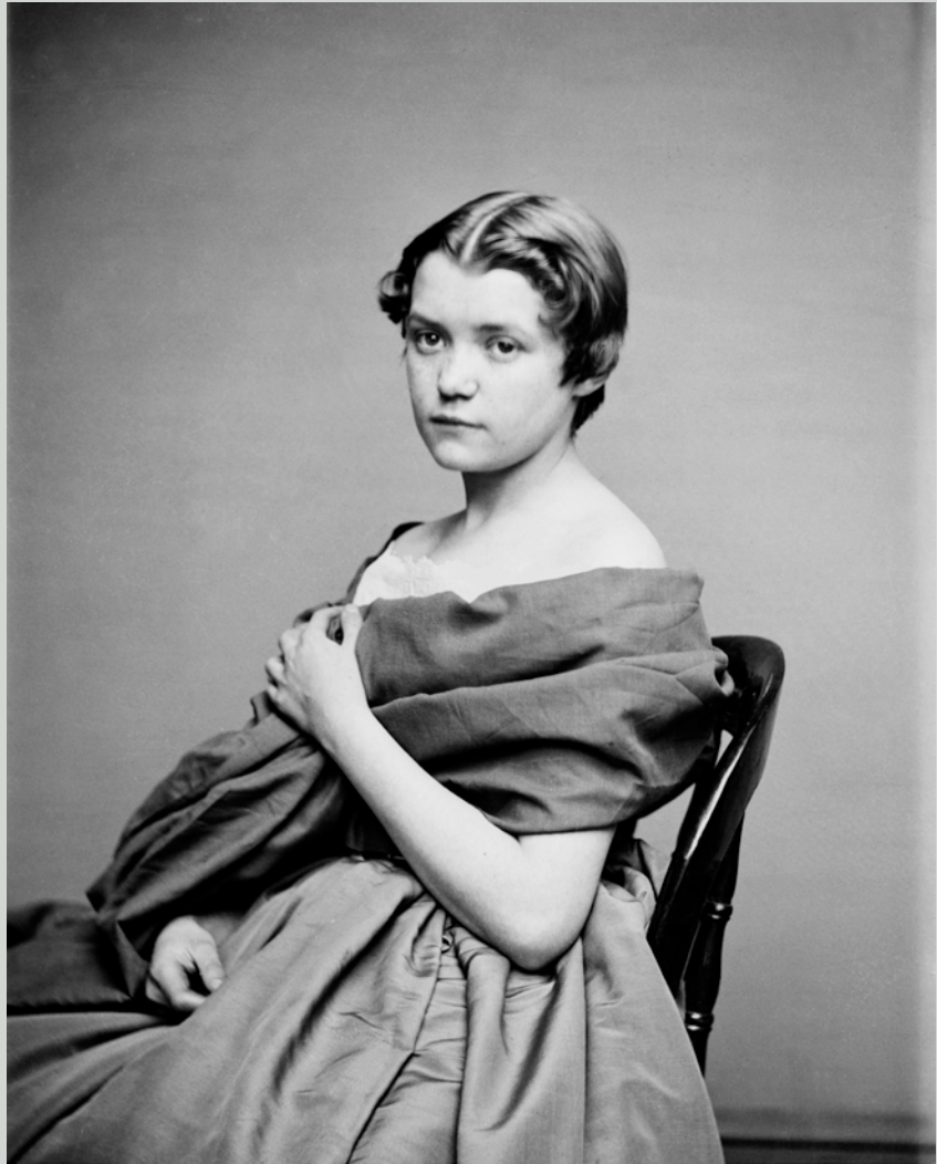
Ein klassisches Porträt aus der Bürgerkriegszeit: Kate Chase, die 22-jährige Tochter von Abraham Lincolns Finanzminister Salmon P. Chase