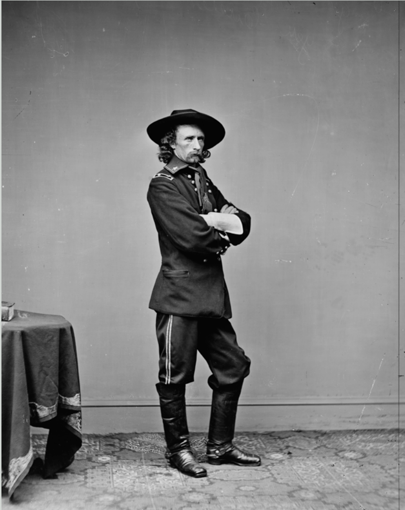
Einer der Helden des Bürgerkriegs und später eine tragische Figur der amerikanischen Geschichte: George Armstrong Custer, fotografiert von Mathew Brady. 1876 verloren Custer und 267 seiner Soldaten in der Schlacht am Little Bighorn ihr Leben.