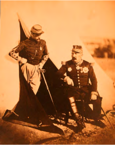
Abb. 1-9 // und Abb. 1-9a //

Roger Fenton: General Bosquet, 1855, und der davon gefertigte Stich, der in der Illustrated London News vom 6. Oktober 1855 erschien. Es ist augenfällig, dass der Künstler sich recht genau an Fentons Vorlage gehalten hat. Lediglich der Hintergrund wurde durch zwei Soldaten »belebt«. Foto: Library of Congress, Prints and Photographs Division, Washington