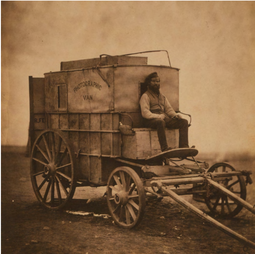
Abb. 1-7 // Roger Fenton im Krimkrieg. Sein Labor befand sich in diesem Wagen. Die niedrige Empfindlichkeit des frühen Kollodium-Verfahrens erforderte sehr lange Belichtungszeiten.