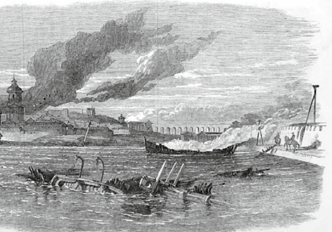
SEBASTOPOL FROM CARENTOVO CREEK, AFTER THE STORMING.—FROM A SKETCH BY R. A. DONALD.

the view with the utmost delight, and soon after, feeling that his life was fast slipping away, he called his remaining strength, took of his knee, and waving it in the air cried, "Adieu, my friends, Sebastopol is ours." Vive a large shout, and he fell back within the burning town. He contemplated in France "Vive l'Empereur!" and in a few minutes afterwards expired.