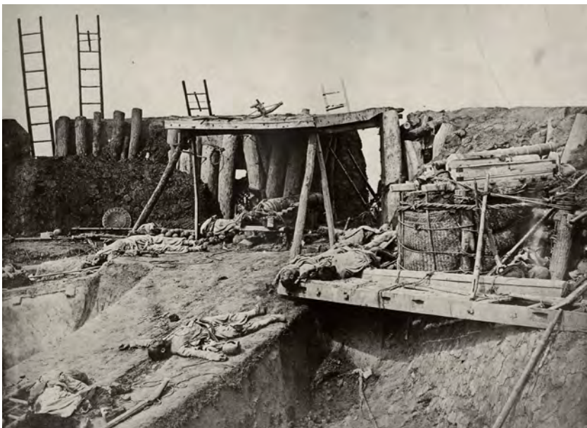
Abb. 1-8 // Felix Beato: Die Festung Taku nach der Einnahme durch britische und französische Truppen, 21. August 1860 (Albumen Silver Print). Beato gehört zu den ersten Fotografen, die sich umfassend mit dem Thema Krieg befassten. Neben dem Krimkrieg fotografierte er auch den indischen Sepoy-Aufstand und den zweiten Opium-Krieg, in dem das gezeigte Bild entstand.