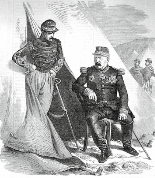
GENERAL BOSQUET.—FROM THE EXHIBITION OF PHOTOGRAPHIC PICTURES TAKEN IN THE CRIMEA, BY ROGER FENTON.

The submarine is situated in the deepest and most stormy part of the bay, surrounded and surrounded by numerous rocks, in the hollow between which habitations for the sappers and others situated by the submarine had been prepared. A number of wooden rafters might be seen strewn along the steep path leading to the submarine. While, in the night, the few captives were held from the Russian towers by the words previously to their arrest, all the wounded who were lowered at the time halted on the summit of the plateau to contemplate the view of the city and harbor, they remained there the whole night, looking at the burning scene. Among them was a sergeant of infantry, who was being conveyed to the submarine on a litter. He felt certain that the vessel was